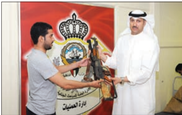
العقيد نايف الحساوي يتسلم سلاحين من مواطن

أكدت إدارة الإعلام الأمني بوزارة الداخلية أن قنوات الاتصال بين المواطنين وفرقة جمع السلاح على الخط الساخن 1888830 مفتوحة على مدار الساعة للإجابة عن أي تساؤلات حول ماهية الأسلحة والذخائر المراد تسليمها وآلية حدوث ذلك أو للاستفسار عن المخفر الذي يتبع المنطقة التي ينتمي إليها المواطن.