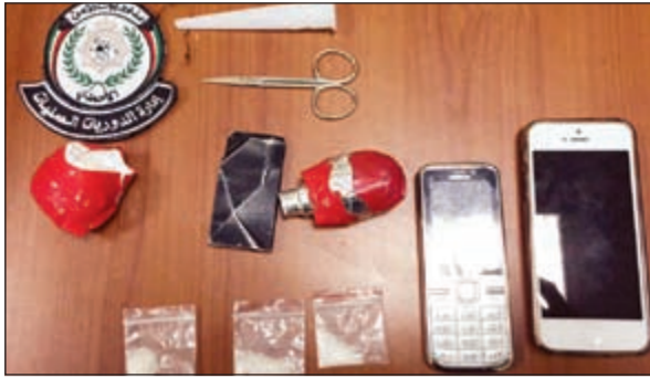
المضبوطات تنوعت بين باج وميروين وأدوات تعاط

في اطار استراتيجية وزارة الداخلية في ان يكمل رجال الامن بعضهم البعض، امر وكيل وزارة الداخلية المساعد لشؤون الامن العام اللواء عبد الفتاح العلي باحالة مواطن الى الادارة العامة للمباحث الجنائية للتحقيق معه في علاقته بجرائم سلب بانتحال صفة رجال امن، خصوصاً في ظل زيادة معدلات هذه الجرائم بصورة لافتة في الآونة الأخيرة.