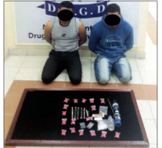
المصريان وأمهما الحبوب والحشيش والأيس إلى جانب خمور