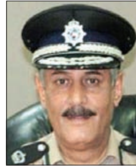
لواء زمير النصرالله

زيادة سحب رخص السوق في مخالفات بسيطة، حيث حدد الكتاب مخالفات رخص السوق في: 1 - السرعة فوق المعدل. 2 - تجاوز الإشارة الضوئية الحمراء. 3 - الاستهتار والرعونة. 4 - القيادة عكس اتجاه السير بالطرق السريعة. 5 - التعمد بتعطيل او اعاقاة حركة المرور. 6 - اجراء سباق للمركبات