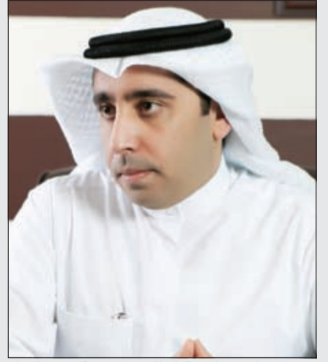
رئيس المهرجان عميد المعهد العالي للفنون الموسيقية د.محمد الديهان