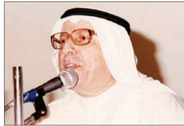
الراحل الكبير عبدالرحمن رفيع