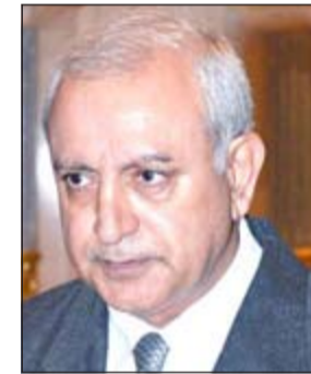
د. بدر العيسى

أو غير مباشرة على الكراهية أو التطرف. وقال العيسى في حديث خاص لـ «الأنباء»: «ان القضية الأولى التي أوليتها الاهتمام الأكبر منذ تسلمي مهام الوزارة كانت المناهج، وتحديدا منهجي التربية الإسلامية واللغة العربية، حيث وجدت أن قضية المناهج تركت تقريبا لم يلتفت إليها أحد مع الأسف من المسؤولين السابقين. ومنذ مدة أتابع مع القائمين على قطاع المناهج من أجل تطويرها، حتى أصبحنا اليوم على أبواب