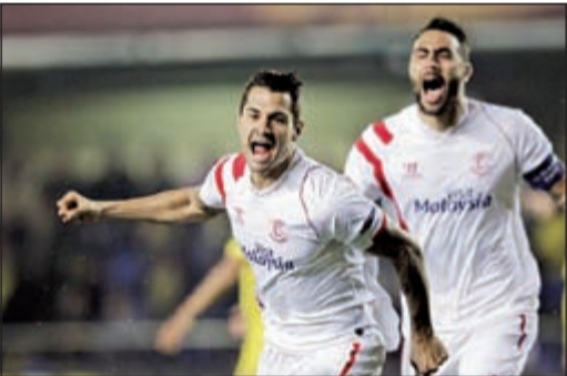
فيتولو يسجل هدف بعد مرور 13 ثانية فقط

استطاع لاعب اشبيلية فيتولو من تحقيق أسرع هدف في تاريخ بطولة أوروبا ليغ على الإطلاق. وسجل فيتولو الهدف بعد مرور 13 ثانية فقط وهو الأسرع في تاريخ المسابقة حيث مر له غاميرو الكرة مباشرة بعد ركلة البداية واسكنها الاول الشباك. وكان الأرجنتيني اسماعيل بلانكو، لاعب ايك اثينا اليوناني، صاحب اسرع هدف في هذه المسابقة ويعود تاريخه الى 9 نوفمبر 2009 في رمي باتي بوريسوف الدياروسى. لكن الهولندي روي ماکاي هو صاحب اسرع هدف في المسابقات الأوروبية بعد 12 ثانية سجله في رمي ريال مدريد الإسباني عندما كان لاعبا في صفوف بايرن ميونيخ الألماني ضمن مسابقة دوري ابطال أوروبا في موسم 2006-2007.