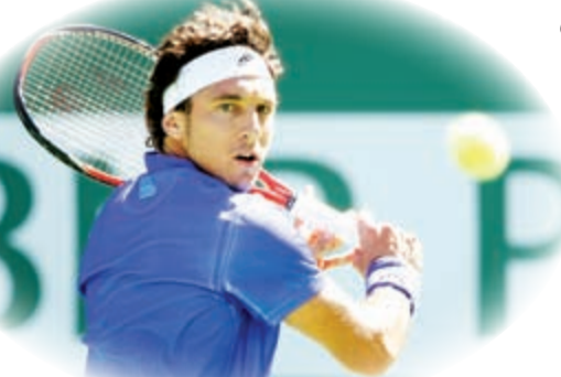
الأرجنتيني خوان مونako نجح في العبور للدور الثاني

عبر الأرجنتيني خوان مونako إلى الدور الثاني من دورة انديان ويلز الأميركية الدولية للتنس بفوزه على الروسي تيموراز غاباشفيلي 6-2 و3-6 و6-3.