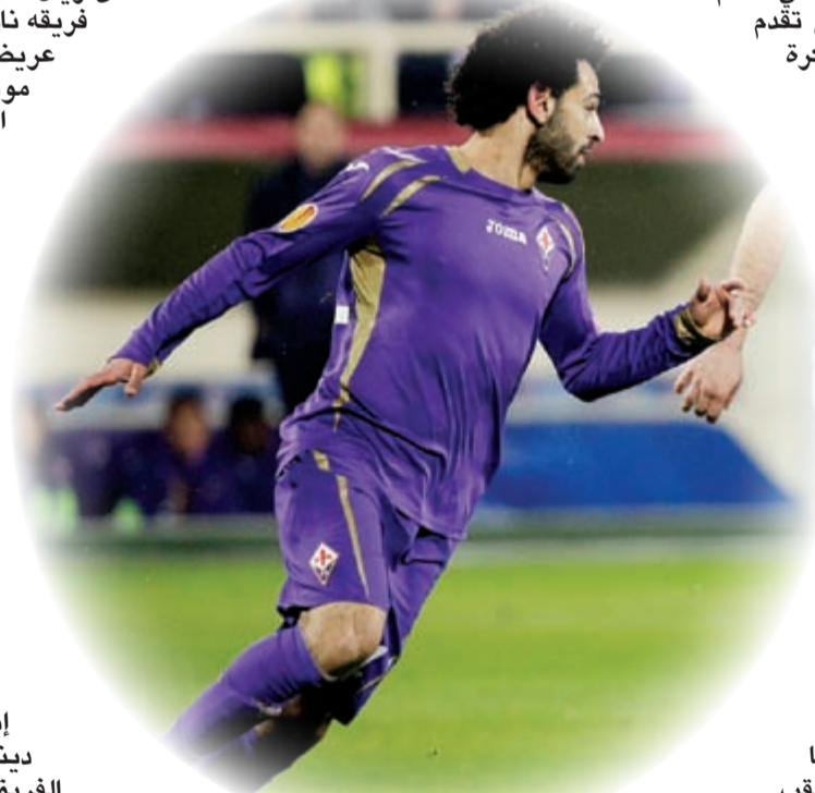
محمد صلاح ساهم بالهدف الأول لفيورنتينا بتمريرة رائعة (روينز)

وكان الضيف سباقا الى التسجيل عن طريق الدولي الألماني السابق المخضرم كيفن كيراني (33 عاما) وورد نابولي بثلاثية عبر هدافه الأرجنتيني غونزالو هيغواين (25 و31 و55). وتحت الأمطار الغزيرة على ملعب غوديسون بارك في مدينة ليفربول، تغلب إيفرتون على ضيفه دينامو كييف 2-1. وكان الفريق الأوكراني سباقا في زيارة شبك صاحب الأرض بواسطة اوليغ غوسيف (14) وأدرك إيفرتون التعادل في الدقائق الأخيرة من الشوط الاول بهدف سستيفن نايسميت (39) وحصل إيفرتون على ركلة جزاء ترجعها لوكاكو بنجاح الى هدف ثان (82).