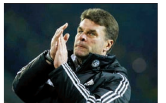
مدرّب فولفسبورغ ديتير هيكينغ

أشاد مدرب فولفسبورغ ديتير هيكينغ بالفوز الذي حققه فريقه على ضيفه الإنتر بـ3 أهداف بهدف، مؤكدا روعة التحول من الهزيمة إلى الانتصار. وقال هيكينغ: «بالطبع، لم أكن سعيدا بهدف الإنتر في الدقائق الأولى. كنا في حالة عصبية في البداية وفقدنا الكرة عدة مرات، نحن أفضل من ذلك وأظهرنا هذا في الشوط الثاني». وأضاف: «كنا أكثر سرعة وحذرا في التمير، هذا هو المفتاح. كانت الطريقة التي حولنا فيها النتيجة لصالحنا رائعة ومذهلة حقا. وضعنا الأساس الصحيح في المباراة لتحقيق هذا الانتصار». وعلى الاعتماد على الهجمات المرتدة، خاصة ان الإنتر في حاجة للفوز بهدفين كي يتأهل».