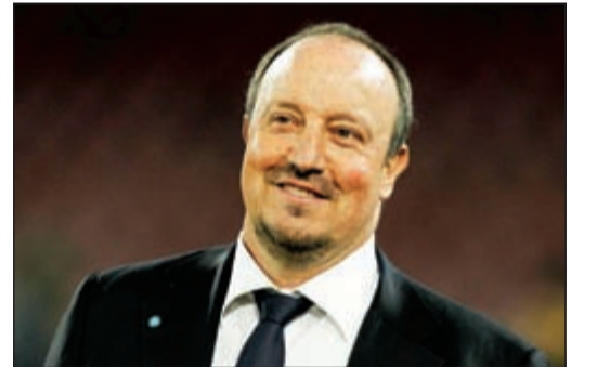
مدرّب نابولي رافاييل بينيتيز

أشار مدرب نابولي رافاييل بينيتيز الى أن فريقه كان لديه عقلية ناضجة عقب الفوز 3-1 على دينامو موسكو الروسي على ملعب سان باولو. وقال بينيتيز لشبكة ميدياسيت: «لقد أعجبتني رد فعل الفريق بعد أن حصلنا على هدف مبكر في بداية اللقاء، كما أننا حاولنا أيضا تسجيل الهدف الرابع ولكننا فشلنا في ذلك». وأضاف: «لقد حققنا خطوة مهمة للغاية الى الامام ولكن التأهل لن يكون سهلا في روسيا، وستعين علينا اللعب بكل جودة للتأهل للدور المقبل». وأختتم بينيتيز حديثه قائلا: «هيجواين مهم جدا بالنسبة لنا فقد قدم مباراة غاية في الروعة، فقام جميع اللاعبين بمساعدة هيجواين على تسجيل ثلاثة أهداف في هذه المباراة».