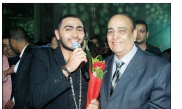
تامر حسني ووالده

أفادت مصادر صحافية بأن الحالة الصحية للفنان حسني شريف والد النجم تامر حسني قد تدهورت منذ أن دخل المستشفى قبل أيام، ويحسب المصابر فإن تامر قد اضطر لنقل والده من المستشفى الذي كان قد دخله إلى مستشفى آخر أملا في أن تتحسن صحته. وقد أخفى الأطباء المعالجون للفنان حسني شريف حالته الصحية، تجنباً لسوء حالته النفسية، حيث تبين أنه يعاني من شبه جلطة في المخ، فضلا عن تضخم في البروستات.