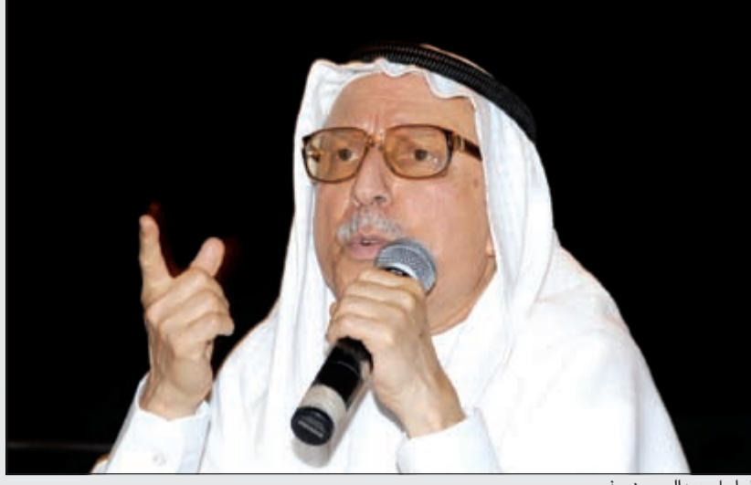
الراحل عبدالرحمن رفيع

وقال: نتقدم باسم المجلس الوطني للثقافة والفنون والآداب إلى أسرته وإلى الأسرة الثقافية والأدبية والإعلامية في مملكة البحرين الشقيقة بخالص العزاء والمواساة، كما نعزي أنفسنا في فقدته باعتباره أحد أبناء الخليج الذين أخلصوا في عطائهم لوطنهم وأمتهم فاستحق منا التقدير والدعاء له بالرحمة والمغفرة.