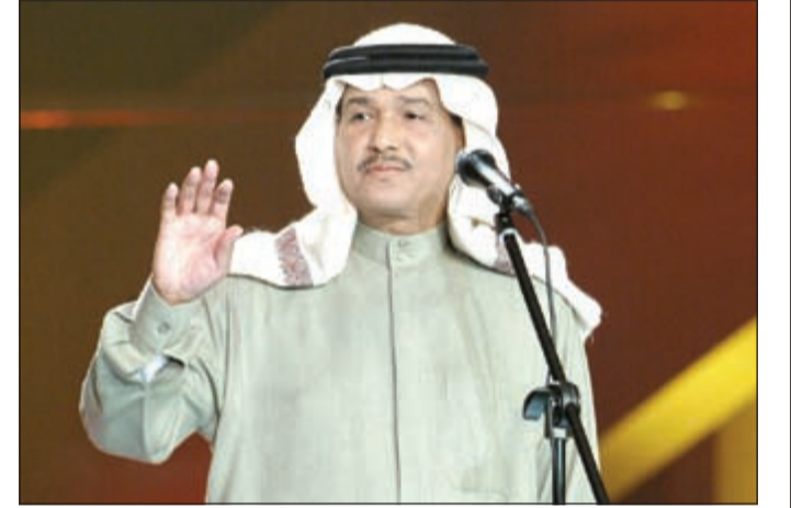
قنان العرب محمد عبده

23 شاعراً، ولحنها 7 ملحنين، وقام بتوزيعها 8 موزعين موسيقيين. وقد استغرق إنجاز هذه الأغاني قرابة ثلاث سنوات، ويقدم رابح لأول مرة في اليوم عملاً للملحن السعودي الشاب عيسى كهرياء، علماً أن نصيب الملحن سهم في جديد «بو صقر» هو 14 لحناً، والعدد ذاته لحنه أيضاً رابح صقر لنفسه، بينما هناك خمس أغان من