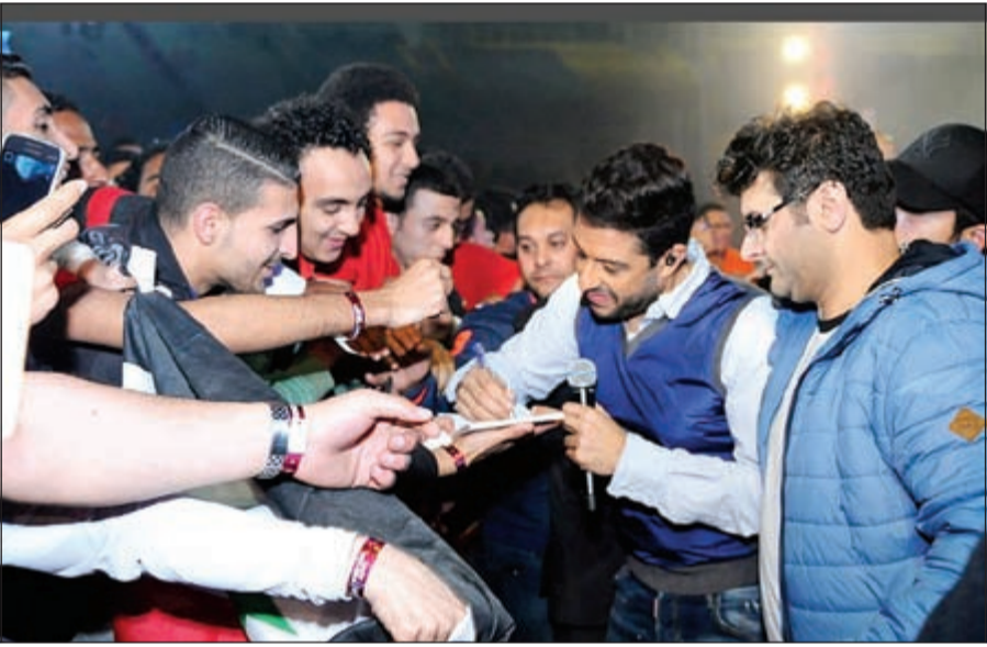
حماتي مع الجمهور في ستاد القاهرة

تألق محمد حماتي خلال الحفلة التي أحيائها في ستاد القاهرة، لصالح إحدى شركات التسويق الشبكي الكبرى. وتعتبر الحفلة الأولى لحماتي بعد انفصاله عن زوجته. وقدم المطرب المصري عدداً من أغنياته الشهيرة منها «أحلى حاجة فيكي»، و«حاجة مستخبية»، و«يانا يانت»، و«ده لولاك»، و«نفسى أبقي جنبه»، و«من قلبي بغني». كذلك، التقط صور «سيلي» على المسرح لمداعية الجمهور كعادته، مما ألهب حماسه طيلة الأمسية. كما قدم، حسب موقع «أنا زهرة»، مفاجأة من أغنيات اليوم الجديد المقرر طرحه خلال الفترة المقبلة.