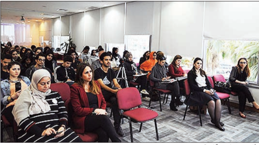
جانب من حضور الندوة