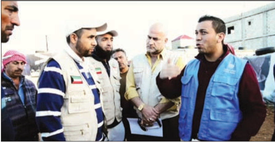
مسؤولو جمعية عبدالله النوري مع ممثلي الجهات اللبنانية

خمس آلاف أسرة بمعدل 25 ألف مستفيد 56٪ منهم من الأطفال وامهاتهم، بلغ معدل رضا المستفيدين 96٪ وفق الاستبيان الميداني الذي شمل 45 شخصا حسب عينات عشوائية من المستفيدين من المساعدات العينية من قوافل ناصر محمد عبدالحسن الخرافي، رحمه الله، جزاهم الله خيرا، وبلغت تكلفة القوافل أكثر من ربع مليون دولار، وفيما يلي رابط لرحلة توزيع المساعدات: http://youtu.be/32MA7Ntrse8