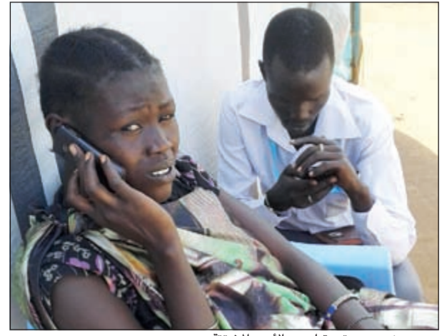
جهود «زين» مستمرة لجمع الأسر المشتتة