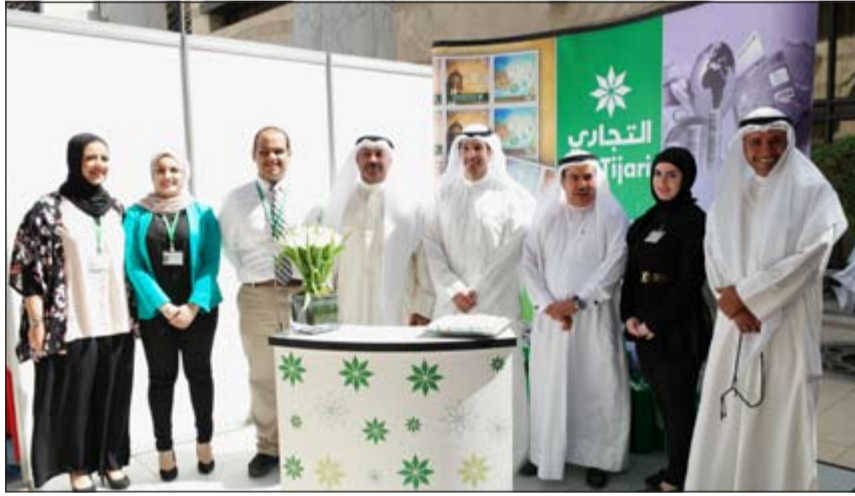
ضيوف المعرض في جناح «التجاري»

بولي اهتماماً بمشاركة السنوية في معرض صناع الاقتصاد، كون هذا المعرض يمثل حلقة وصل بين البنك وبين الطلبة الراغبين في الحصول على فرص عمل قبل تخرجهم، فضلاً عن أنه يعتبر وسيلة لإطلاع الطلبة عن كذب على توجهات وسياسة البنك في مجال التوظيف والموارد البشرية ومزايا العمل في البنك. ويضع البنك التجاري الكويتي الشباب الكويتي الطموح في بؤرة اهتماماته ويوفر لهم فرص عمل واعدة بالبنك لزيادة نسبة العمالة الوطنية لديه، ضمن إستراتيجيته الرامية إلى تطوير الاحترافية والمهنية لدى الشباب الكويتي في إطار التخطيط السليم للتعاقد الوظيفي والإعتماد على المواطن الكويتي بالدرجة الأولى لتحقيق المزيد من النجاحات مستقبلاً.