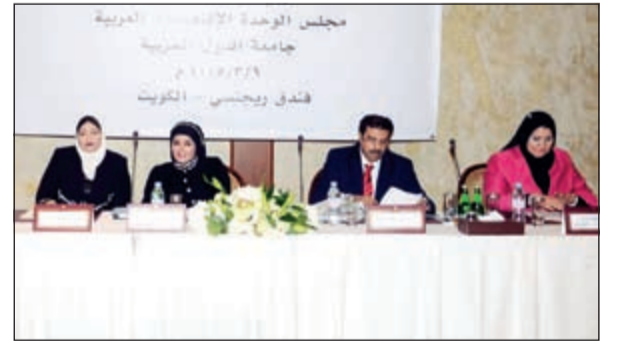
الشيخة نوال الصباح أثناء انعقاد الاجتماع

الكمايات والمشغولات اليدوية، والعبوات والتجميل والملايش والدرابيع والشيلات، والعباءات النسائية والملامع والبخور، واكسسوارات غرف النوم والشراشف وأطقم اللحف والمناشف، والشنط والأحذية وملابس الأطفال وغيرها من المستلزمات القرطاسية والعودة المدارس. ويشتمل المعرض على معروضات ومنتجات من بلدان مثل: لبنان وسورية والأردن وفلسطين وتركيا والهند وباكستان والصين ومصر وتونس والمغرب والسودان تستعرض في الكويت كل البضائع العالمية تحت سقف واحد، حيث يحفل بأنشطة هامة عديدة ويستهدف استقبال شرائح مختلفة من الزبائن لإرضاء مختلف الأذواق.