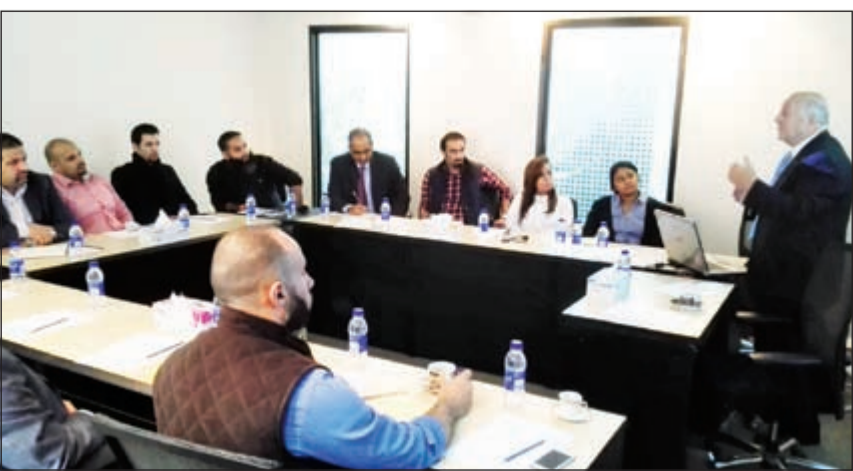
جانب من الدورة

أقامت شركة المستقبل للاتصالات دورة تدريبية مكثفة في شهادة الآيزو 22301 المتخصصة في إدارة الأزمات والمخاطر وتناولت الدورة أهمية هذه الشهادة ومتطلباتها والتي تعد المستقبل لاتصالات الشركة الأولى بالكويت التي ستحصل عليها.