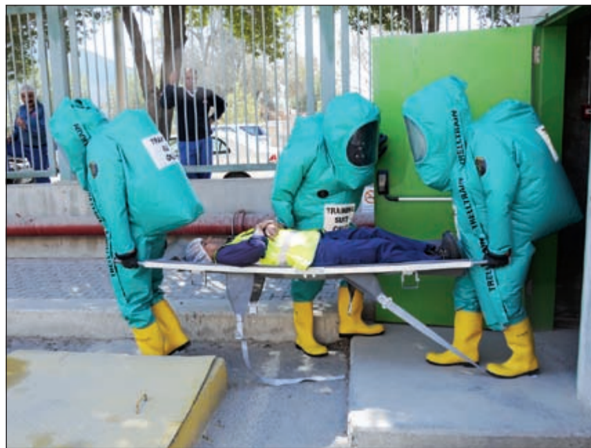
جانب من التمرين الوهمي

من موقع الحادث يوجد تسرب غاز الامونيا للمصنع ووجود مصاب، وتم تعامل فرقة المواد الخطرة وتمت تطهير المصاب واخلاء المكان وتسليم المصاب للإسعاف. كما تمكنت وتعاملت فرق الإطفاء مع الحادث والسيطرة عليه في زمن قياسي. وأشاد القبايدون وإدارة المصنع بأداء المشاركين في التمرين والتزامهم بالتعليمات، مما يعكس حسن التدريب الذي تلقوه، ومطالبتين في الوقت ذاته بالاستمرار في بذل الجهود للحفاظ على هذا المستوى الذي يمكن من جاهزية رجال الإطفاء في أي وقت.