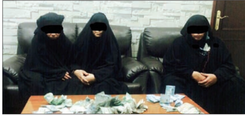
المتسولات الثلاث الى الإبعاد الإداري