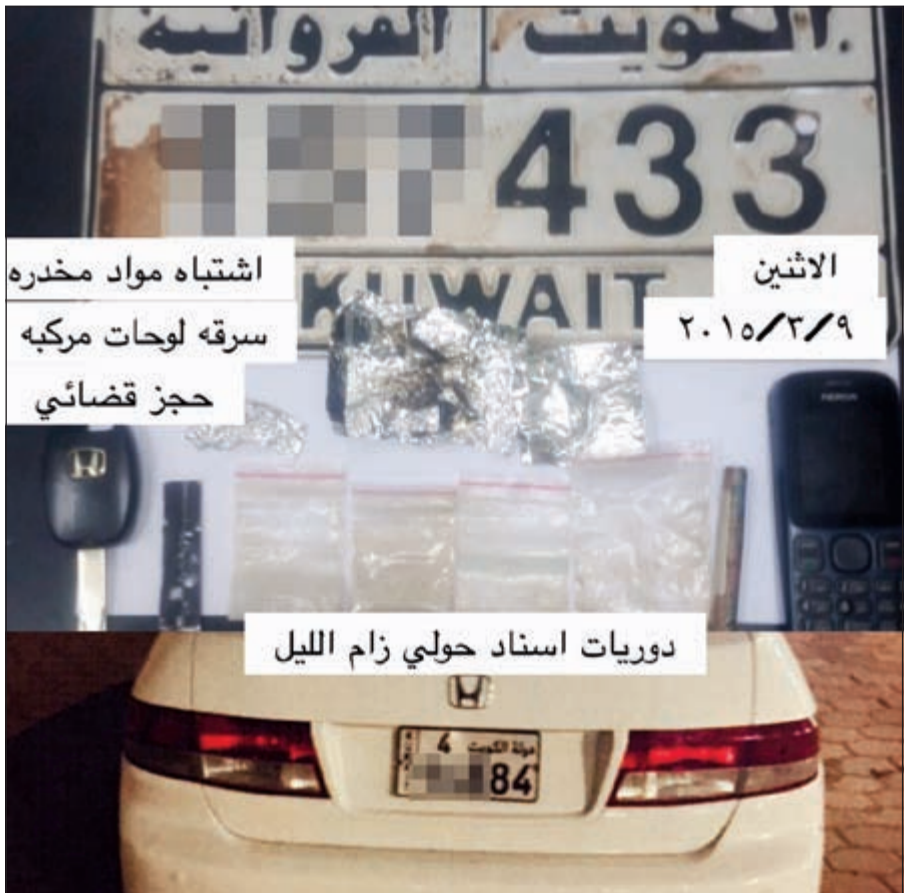
للوحة والمخدرات إلى الاختصاص

غير طبيعية وغير قادر على الاعتناء بنفسه ومن ثم تم الطلب من المدعو النزول لإدخاله الدورية لتحويله اشتباها بحالة غير طبيعية وتم تفتيشه اخترازياً قبل ركوبه الدورية عثر معه على مواد يشتبه في أنها مخدرة عبارة عن 4 أكياس يوجد بداخلها مادة لونها بيض يشبه في أنها مخدرة (هيروين) كذلك أدوات تعاط وتم الاستعلام عن المركبة وتبين أن اللوحة يوجد عليها قضية سرقة نفس مخفر النقرة وأن المدعو أعلاه قام بتغيير لوحة المركبة كذلك تم الاستعلام عن المركبة عن طريق رقم الشاصي وتبين أن المركبة محجوزة قضائياً وإدارياً ومن ثم تمت إحالة المركبة إلى مخفر النقرة والمدعو أعلاه إلى الإدارة العامة لمكافحة المخدرات والخمور حيث الاختصاص.