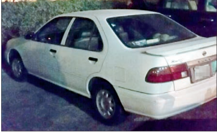
السيارة بعد العثور عليها