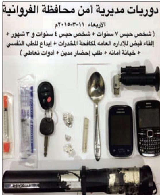
ادوات التعاطي التي ضبطت في محافظة الفروانية