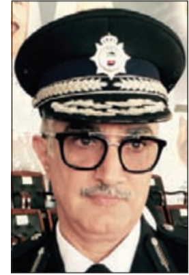
اللواء ابراهيم الطراح