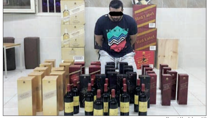
المتهم وامامه المضبوطات