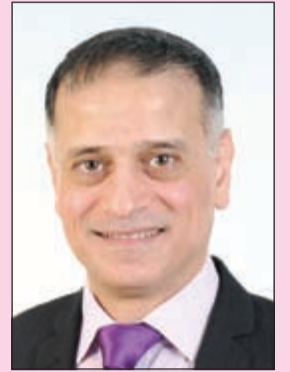
إعداد: د. طارق البكري

سعدنا كثيرا بالترحيب الكبير الذي تلقيناه منكم خلال الأسبوع الماضي منذ انطلاق صفحتكم الجديدة، وبالطبع كنا نتوقع ذلك، لأنكم كما نعلم تحبون العلم والقراءة والقصص والرسم والتلوين، كما تحبون اللعب والمرح والتسالي. فالعلم هو مفتاح كل شيء في الحياة، والله تعالى يقول (وقل رب زدني علما)، وقال الشاعر «العلم يرفع بيتا لا عماد له...» تطور الإنسان يقاس بعلمه ومعرفته، ولا يقاس بطوله وعمره، فكم من أشخاص عاشوا كثيرا لكنهم لم يفيدوا غيرهم، ولم يستفيدوا من العلم إلا قليلا، لأن العلم يفيد صاحبه أولا ثم يفيد مجتمعه ووطنه، ثم الدنيا بأسرها. والعلم يا أبنائي الأحبة أفضل من المال، لأن المال تحرسه أما العلم فيحرسك. كما أن العلم يجب أن يسبق العمل، فلا عمل صحيح بغير علم صحيح، وكما قالوا: بالعلم والعمل تبنى الأمم.