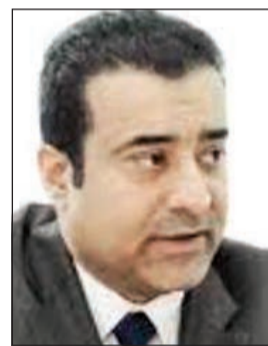
د.عبد المحسن التركي

النوم يسبب أمراضاً مزمنة، مشيراً إلى أن ذلك ينتج عنه سوء تعامل الجسم مع السكريات ومقاومة الجسم لمفعول هرمون الأنسولين، واحتمال الإصابة بمرض السكري. ولفت التركي إلى أن الباحثين قدروا من خلال الدراسات الميدانية أن 15% من المصابين بتوقف التنفس يعانون من مرض السكري و50% من المصابين بتوقف التنفس يعانون من مرض السكري أو اختلال تعامل