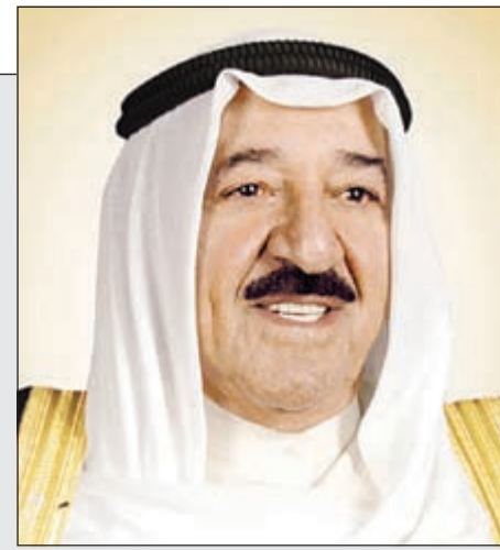
صاحب السمو الأمير الشيخ صباح الأحمد