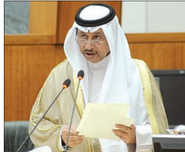
سمو الشيخ جابر المبارك ملكياً بيان الحكومة أمس

الرياض - وكالات: أكدت دول مجلس التعاون الخليجي أمس أن لديها «من الإمكانيات والإجراءات لحماية حدودها وسيادتها»، داعية إلى إخلاء منطقة الشرق الأوسط من جميع أسلحة الدمار الشامل. وفي ختام اجتماع وزراء خارجية دول المجلس في الرياض أمس، قال وزير الخارجية قطر خالد العتيبة