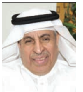
السفير د.عبدالعزیز الفايز

السفير السعودي: خادم الحرمين يضع خارطة طريق واضحة لمستقبل الوطن