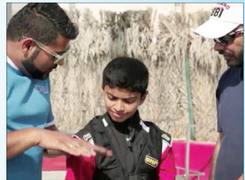
تعليمات قبل انطلاق السباق