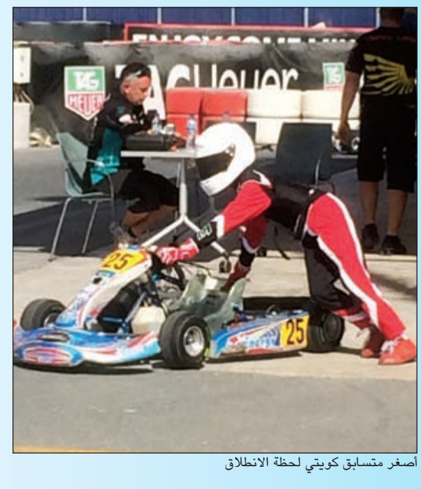
أصغر متسابق كويتي لحظة الانطلاق