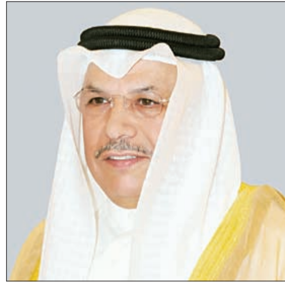
نائب رئيس الوزراء ووزير الدفاع الشيخ خالد الجراح

في هذا مؤشرا إيجابيا لنا جميعا بان رياضة السيارات الكويتية قادرة على بلوغ أعلى المراتب في ظل وجود طاقات شبابية كويتية تحمل عدد من الأمال بأن يكون للكويت نصيب الأسد في تلك الإنجازات الرياضية التي تتحقق في منطقة الشرق الأوسط وشمال أفريقيا (مينا) مؤكدا في الوقت ذاته ان رالي الكويت يعتبر من أفضل الراليات في المنطقة من حيث جغرافيته التي تساعد وبصورة مباشرة على أداء مميز للمشاركين، متمنيا أن تنتهي أحداث الرالي بوصول كل المشاركين الى نقطة النهاية بسلا.