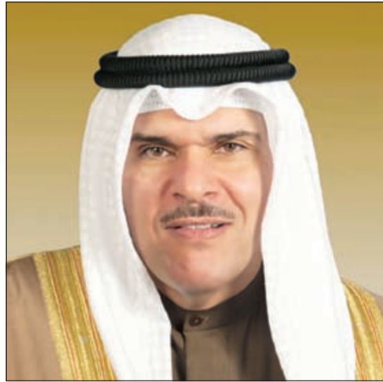
وزير الاعلام ووزير الدولة لشؤون الشباب سلمان الحمود