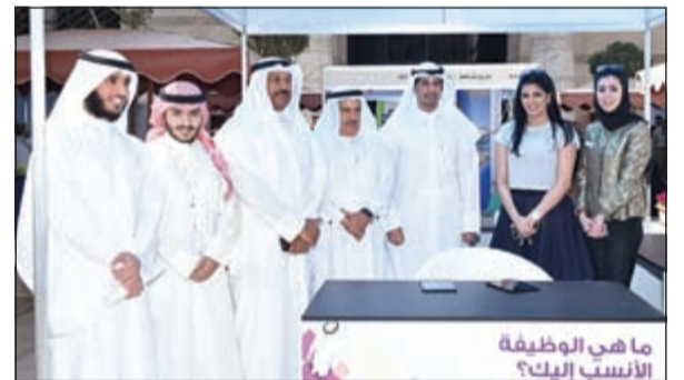
الوكيل المساعد لقطاع تنمية الشباب في وزارة الدولة لشؤون الشباب يتوسط ممثلي شركة VIVA في افتتاح معرض الفرص الوظيفية