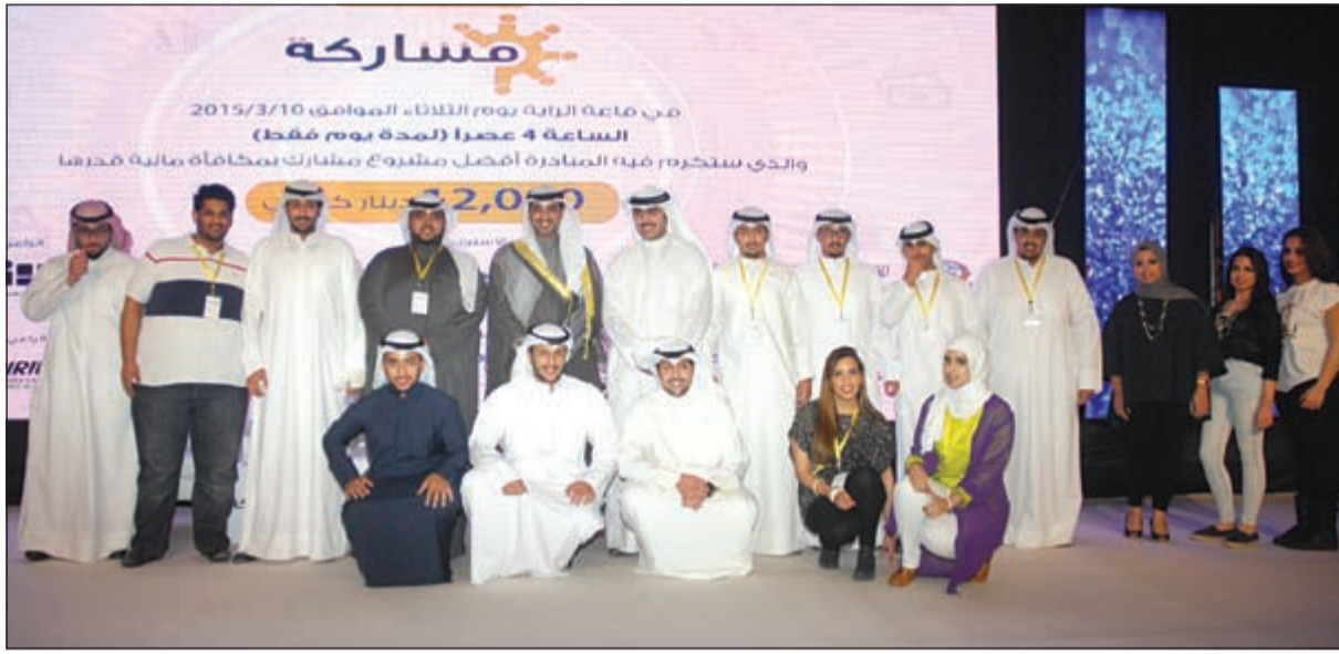
لقطة تذكارية للمنظمين يتوسطهم الشيخ محمد العبدالله