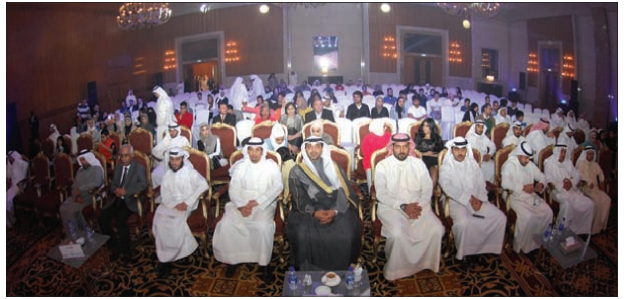
حضور كبير للحفل

لكل حبة 15 سم ووزن 6 كيلو في الصينية الواحدة، وبذلك يكون وجبة دسمة للحيوانات بنسبة بروتين تصل إلى 34% وهو غني بعناصر الفوسفات وإنتاجيته تزيد بازدياد عدد الصوتي غير المتخامي وذلك حسب عدد الأرفق والصواني، قد يصل إلى 10 أطنان شعير مستنبت وأكثر، ويمكن أيضاً استنبات الذرة وقول الصويا والقمح، كما توفر تلك الطريقة نسبة 80% من مصاريف الأعلاف.