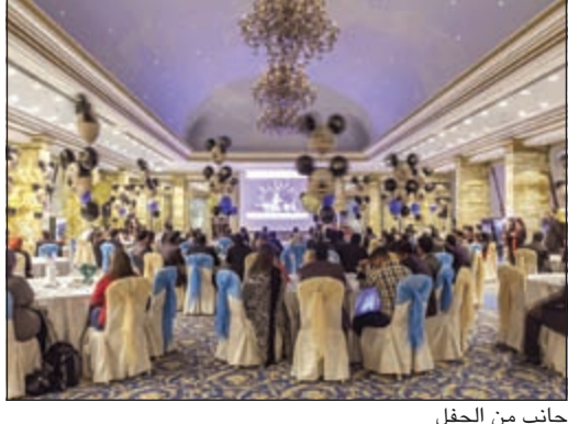
جانب من الحفل