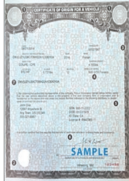
نفس اللقطة توضح البيانات المؤمنة التي تظهر باستخدام الأشعة فوق البنفسجية