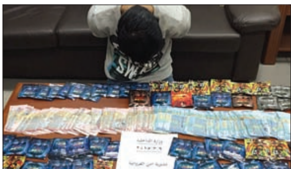
المتهم وإمامه أكياس الـ «سبايسي»