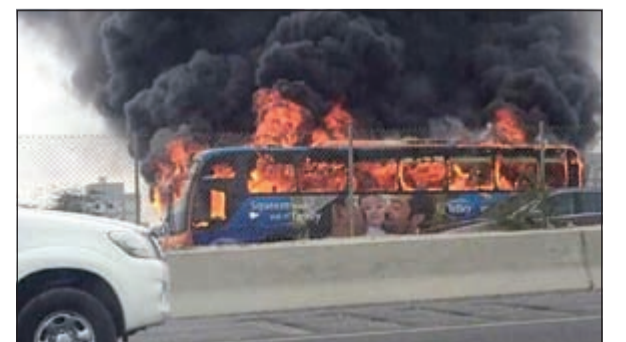
النيران آتت على الباص بالكامل