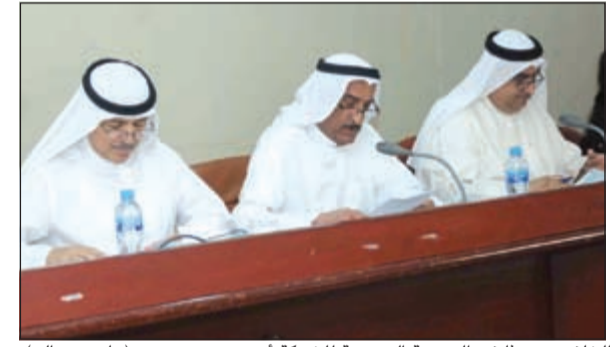
الخلف متحدثاً في الجمعية العمومية للشركة أمس (هاني عبدالله)

تزيد اليمن بحوالي 260 ألف طن من المنتجات وجيلوتي بحوالي 240 ألف طن. بالإضافة إلى تزويد السعودية والأردن والبحرين والإمارات بكميات مختلفة من المنتجات. وأفاد بأن المجموعة تمكنت من تسويق 280 ألف طن من المنتجات في دول شرق أفريقيا خلال عام 2014 بالرغم من المنافسة الحادة بين شركات البترول العالمية، وتعمل المجموعة على زيادة مبيعاتها في هذه المنطقة خصوصاً في زيمبابوي ومايوي ويتسوانا والكونغو، حيث تعتبر المجموعة هذه الأسواق منفذاً استراتيجياً لمنتجاتها. وفيما يخص نشاط الشركة في البحر الأبيض المتوسط والبحر الأسود سوقت الشركة نحو مليون من المنتجات خلال 2014 منها 800 ألف طن لشركة يونيترمينال الملوكية بنسبة 50٪ للمجموعة حيث قامت المجموعة بشراء هذه المنتجات في البحر الأحمر، مضيفاً أن الشركة زودت بعض الشركات المغربية بالمنتجات البترولية لتسويقها في السوق المحلي في المغرب. وأشار الخلف إلى أن المجموعة قامت بشراء 100 ألف طن من الديزل والبترولين بالشراء الفوري من الشرق الأقصى والهند نظراً لوضع السوق، فيما قام قسم الشحن بالمجموعة بتنفيذ 151 عملية شحن خلال العام الماضي وتبلغ الكميات التي قامت المجموعة بشحنها 4,7 ملايين طن منتجات بترولية.