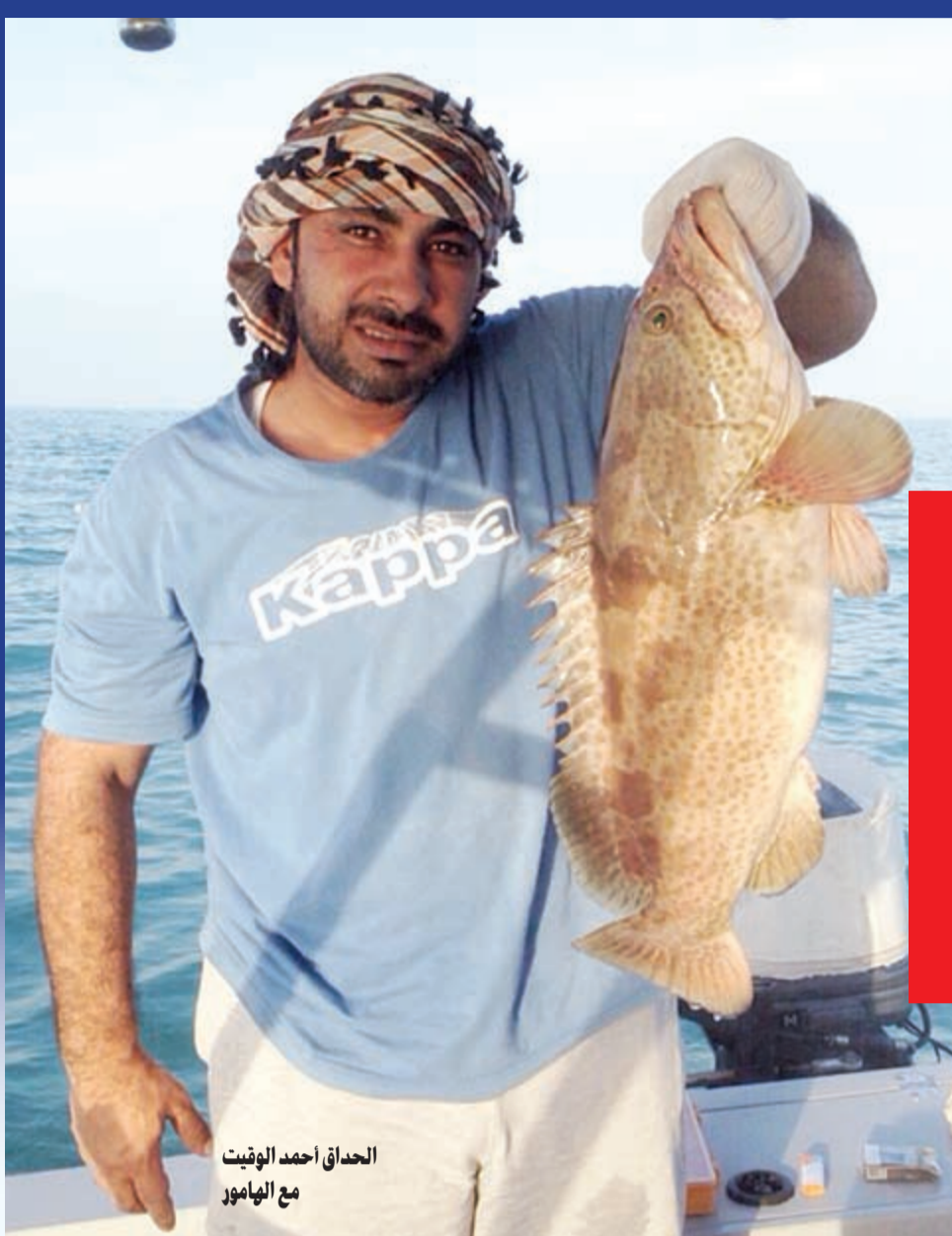
الحدائق أحمد الوقت مع الهامور