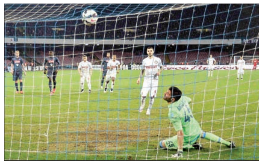
ماررو ايكاردي انقذ انتر ميلان من الخسارة أمام نابولي

فرنسا استعاد ليون الصدارة بفوزه الكاسخ على مضيفه مونبلييه 5-1 في ختام المرحلة الثامنة والعشرين من الدوري الفرنسي. ورفع ليون رصيده الى 57 نقطة وتقدم بفارق نقطة واحدة على باريس سان جرمان بطل الموسم السابق الذي اكتسح امس ضيفه لنس 4-1. واستعاد سانت اتيان نغمة الفوز بتغلبه على ضيفه لوريان 0-2 بعد 7 مراحل لم يعرف فيها طعم الانتصار.