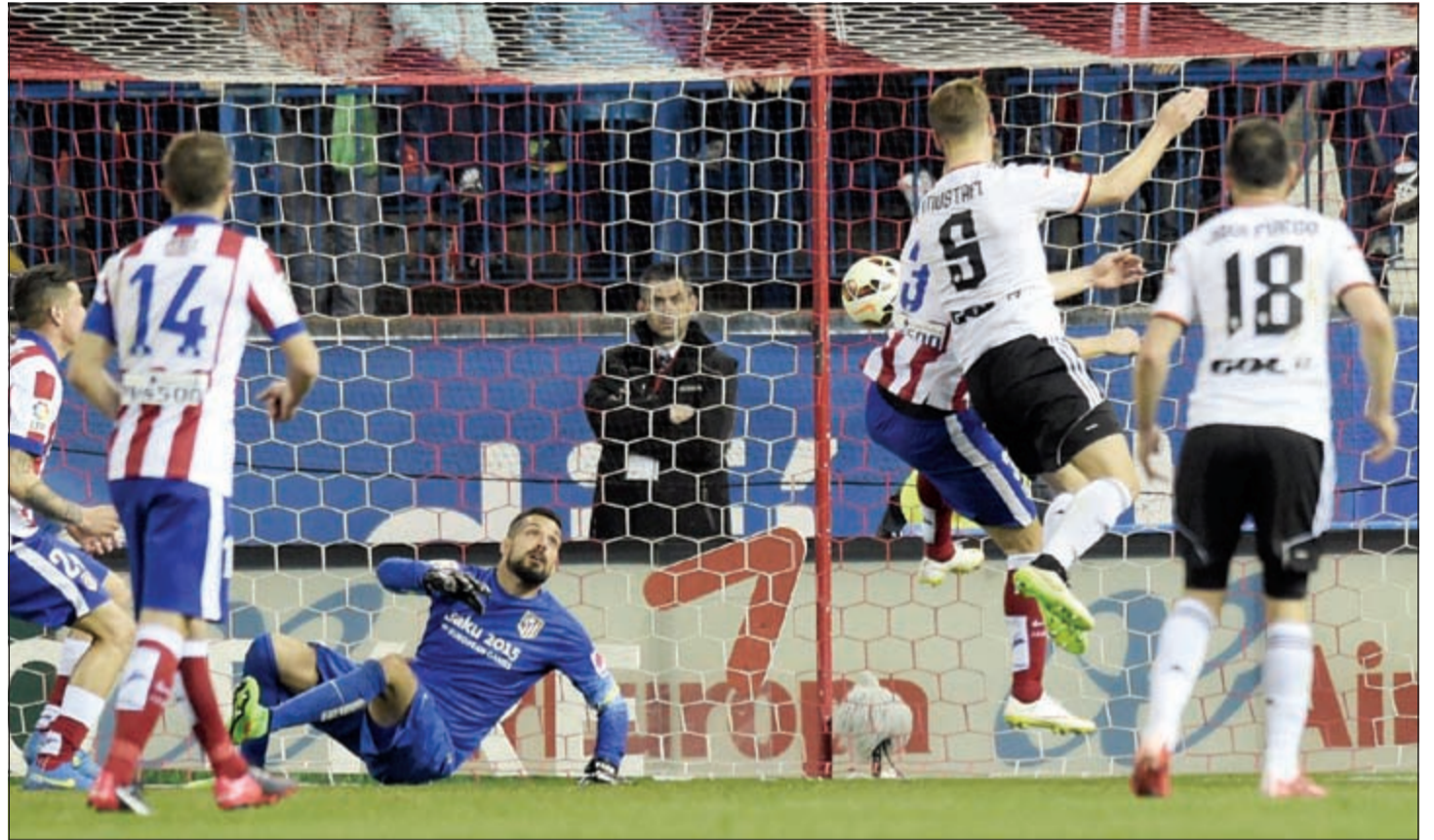
كرة الألماني شكوردان مصطفي في طريقها لشباك اتلتيكو مدريد

تابع نجم اوكلاهوما سيتي فاندر راسل ويتسبروك عروضة القوية في الأونة الاخيرة ونجح في تحقيق خامس «تريبل دولبل» له في آخر ست مباريات ليقود فريقه الى الفوز على تورونتو رابتورز 108-104 ضمن دوري كرة السلة الأميركي للمحترفين. وسجل ويستبروك، الذي يضع قناعا بسبب كسر في وجهه، 30 نقطة ونجح في 11 متابعة و17 تمريرة حاسمة محققا سابع تريب دولبل له هذا الموسم. وسجل أبنيس كانتر 21 نقطة وزميله سيرج ايساكا 21 نقطة و7 متابعات للفائز، في حين كان ديمار ديبورزان أفضل مسجل في صفوف تورونتو برصيد 24 نقطة وتسع متابعات تلاه زميله تيرينس روس برصيد 20 نقطة. وتالق الفرنسي توني باركر في صفوف