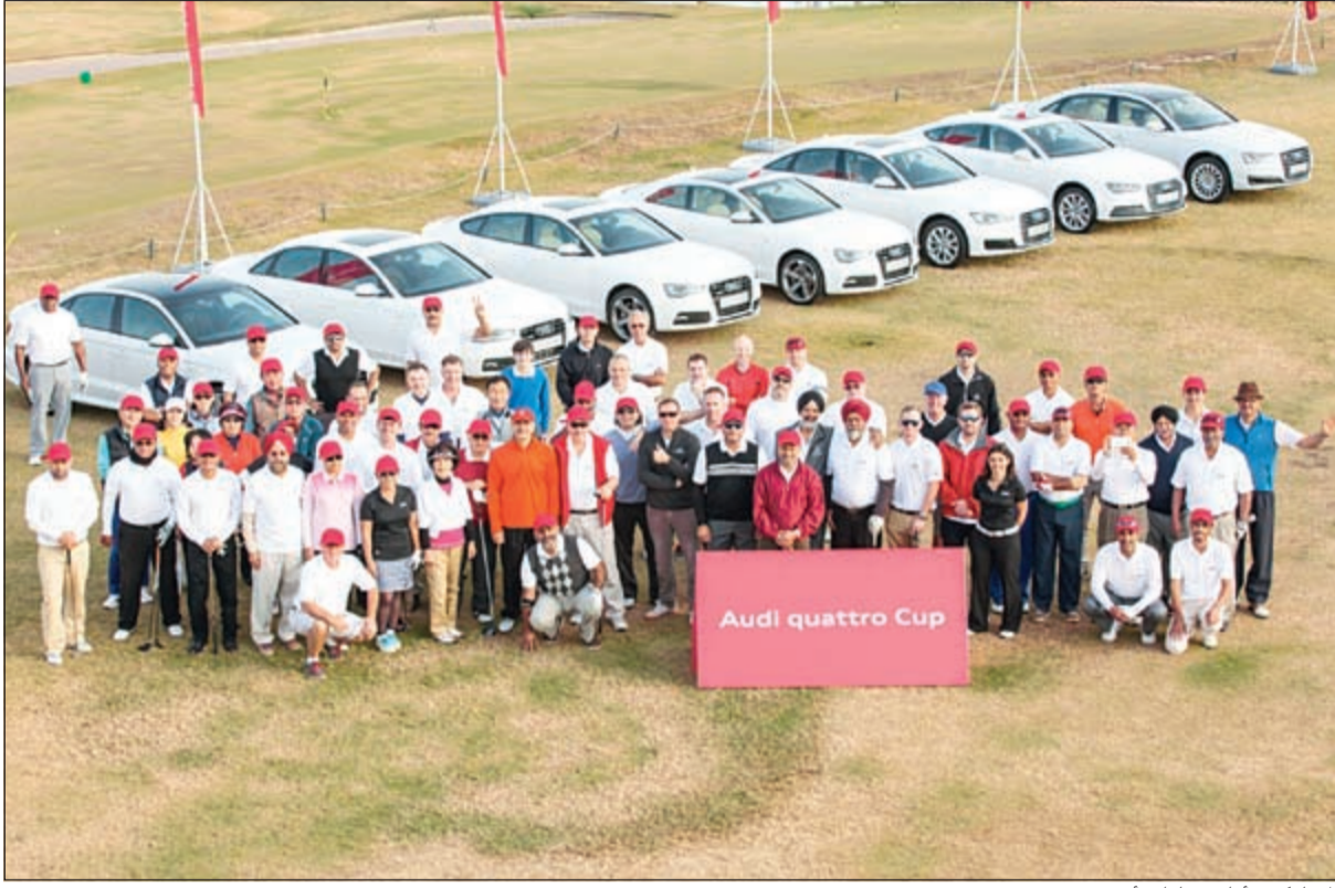
المشاركون أمام سيارات أودي