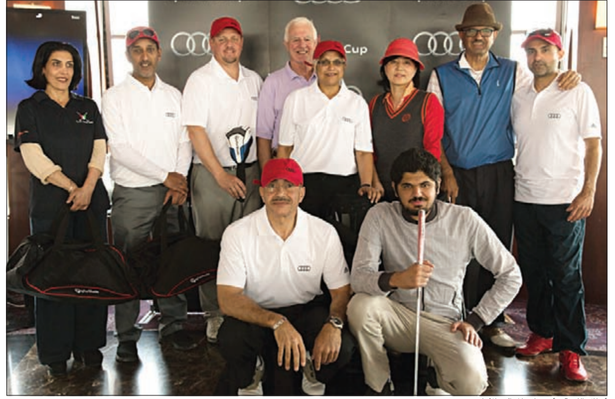
أبطال اللعبة وأصحاب المراكز الأولى

حول العالم تتكون من 808 بطولات وشارك فيها أكثر ما يقارب 100 ألف من لاعبي الغولف الهواة. وقد شارك أكثر من مليون و300 ألف لاعب غولف في بطولات كأس أودي quattro في السنوات الـ 24 الماضية.