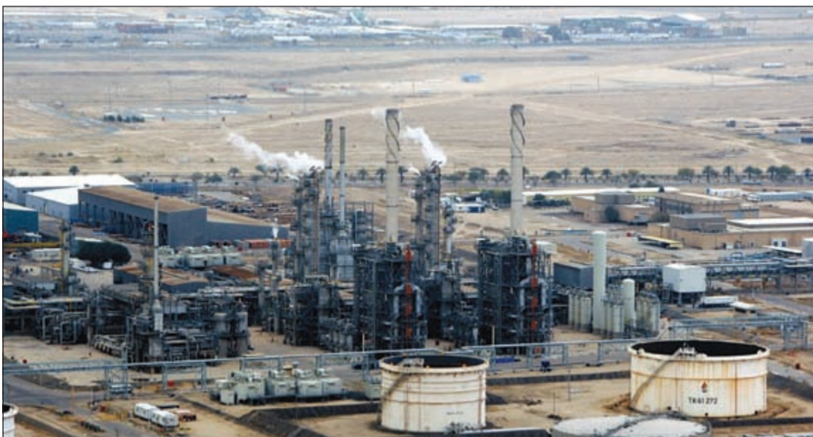
الكويت تستعد لتنفيذ أكبر مشاريعها النفطية بإنشاء مشروع مصفاة الزور الذي طال انتظاره

ومع استقبال شركة البترول الوطنية للعطاءات المالية للحزم الخمس من مشروع المصفاة تكون الرؤية قد اتضحت للأسعار وذلك عقب ارتفاع أسعار العطاءات المالية للحزمتين الرابعة والخامسة لتبلغ بذلك الأسعار التي استقبلتها الشركة للمشروع 4,1 مليارات دينار، أي بارتفاع قدره 100 مليون دينار عن الميزانية المعتمدة للمشروع من قبل