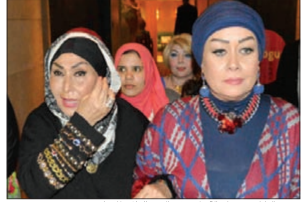
سهير البابلي ومعها هالة فاخر في اليوم العالمي للمرأة

لم تستطع الفنانة المصرية القديرة سهير البابلي تماثل أعصابها أمام القنصوات الفضائية والصحافيين