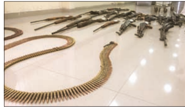
أسلحة تم تسليمها