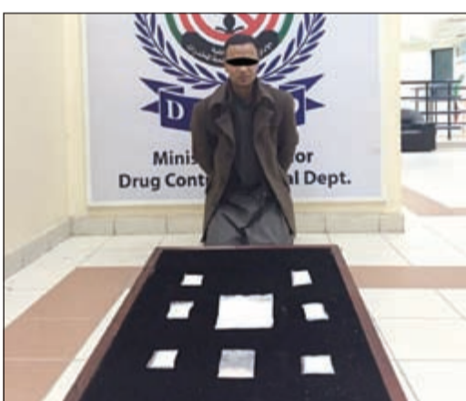
«الآيس» المضبوط من قبل «مكافحة المخدرات»