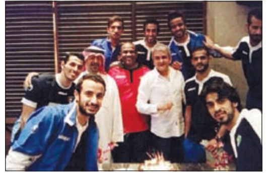
فهد عوض يحتفي بالمطوع

استقبل رئيس الاتحاد الشيخ د.طلال الفهد مساء أمس الأول رئيس الاتحاد الكوري الجنوبي لكرة القدم مونغ جيو شونغ في مقر الاتحاد، حيث تبادل أسلوب التعاون الثنائي للاتحادين لما فيه مصلحة الكرة الكويتية والكورية. وأشاد شونغ بحفاوة الاستقبال التي حظي بها منذ وصوله للكويت والتعاون المثمر الذي لمسه من خلال استقبال الفهد له ومناقشة الخطط والبرامج المستقبلية التي تخدم الطرفين بالإضافة إلى تبادل زيارات المنتخبات الوطنية ضمن إطار تطوير التعاون وللنهوض بالمستوى الفني للكرة الكويتية والكورية.