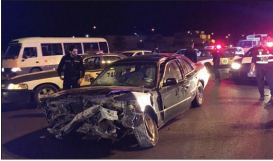
مركبة للصوص الثلاثة وقد تهشمت بعد اصطدامها بالحاجز الاسمنتي

بين المركبات بطريقة مخيفة، لترتطم بالحاجز الأوسط، وتبين أن بداخل السيارة قائدها وهو خليجي مطلوب إلقاء القبض عليه للمباحث الجنائية ومطلوب كمدین لـ 3 قضابا بمبلغ 1422 ديناراً والثاني غير كويتي مطلوب بحبس جنائي لمدة 4 أعوام «قضية مخدرات»، والثالث عراقى مطلوب للسجن شهرين، وبنفس السيارة عثر معهم على 6 خواتم يشتبه في أنها مسروقة.