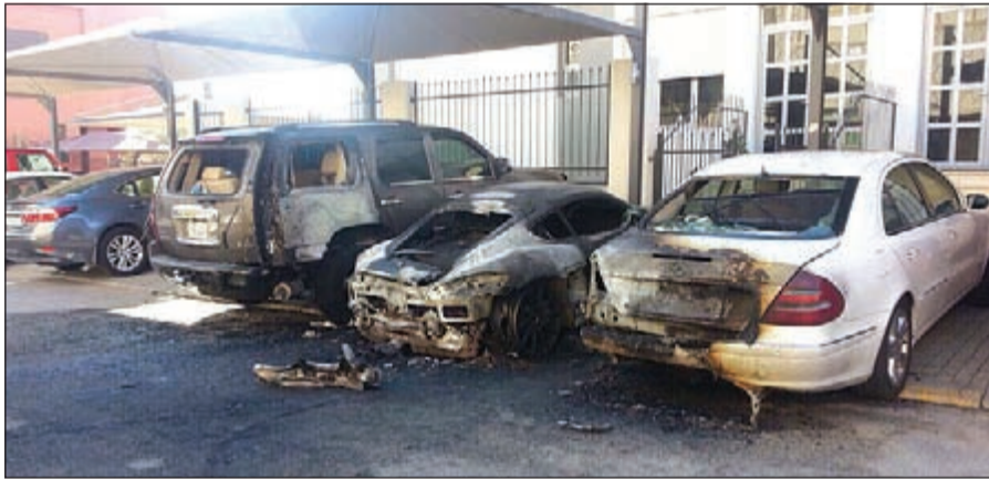
المركبات المحترقة تقدر قيمتها بنحو 100 ألف دينار

في ملف القضية تقريراً اوليا صادرا عن الإطفاء يشير إلى أن الحريق متعمد وهناك آثار.