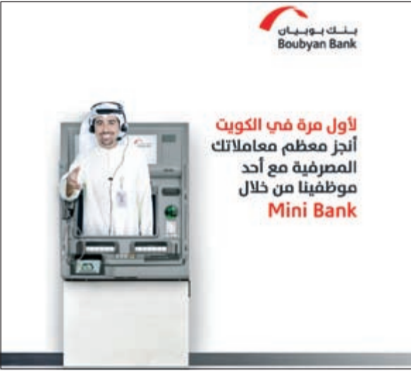
جهاز Mini Bank الذي ينفرد بتقديمه البنك