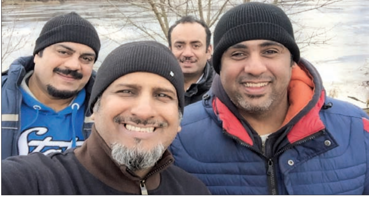
نجوم الفيلم أثناء التصوير في أوكرانيا