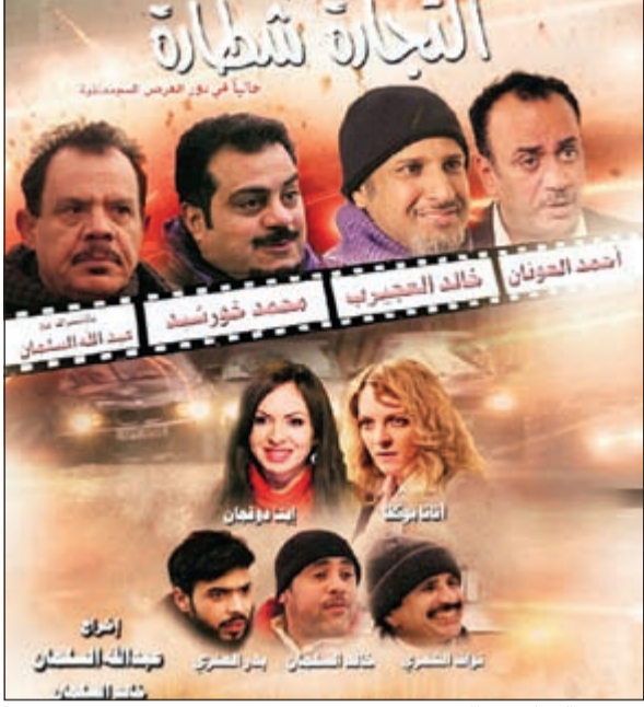
بوستر «التجارة شطارة»