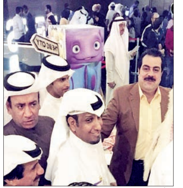
من أجواء العرض الخاص في سينما الحمرا مول