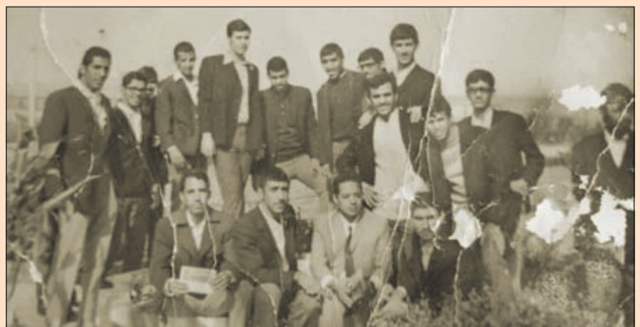
الخضر مع مجموعة من المدرسين في مدرسة الفنتاس