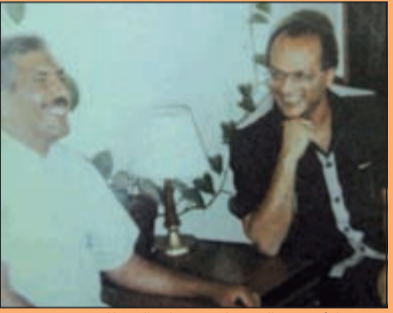
و.م.ع. الأديب والصحافي جمال العيطاني