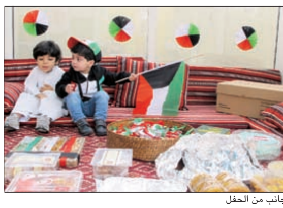
جانب من الحفل