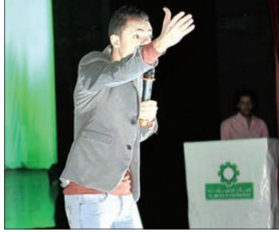
أحدى فقرات الحفل