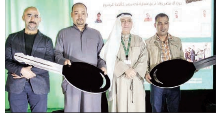
تكريم الفائزين بعرض السيارات