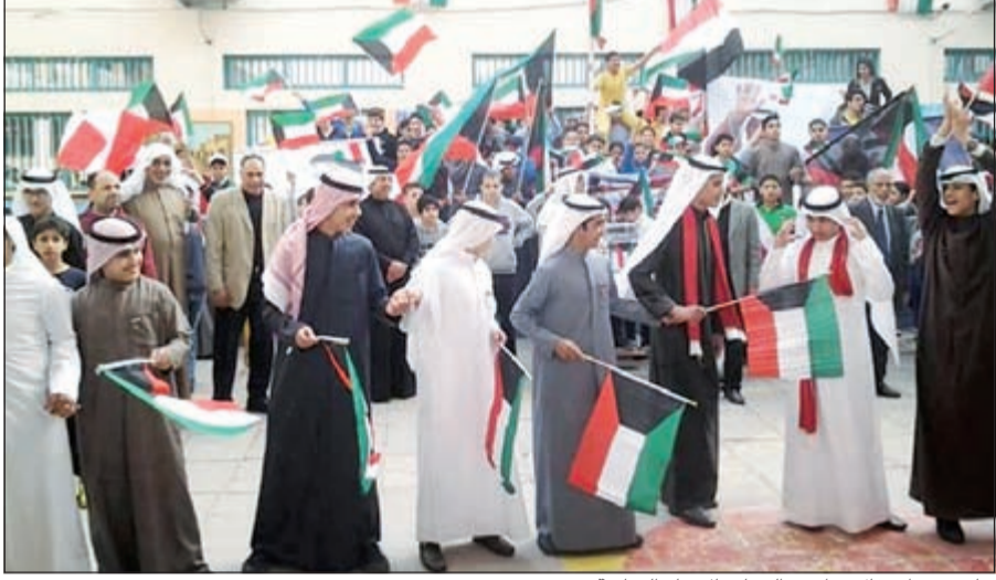
جانب من احتفال مدارس النجاة بالأعياد الوطنية

تخريج جيل قادر على تحمل المسؤولية ومحافظ على قيمه الدينية والثقافية وفق منهج وطني قائم على تعميق الولاء للدين والوطن، وقد تميزت مخرجات مدارس النجاة بطلاب بارعين في مجالات العلوم والرياضيات واللغة الإنجليزية بما يؤهلهم ليكونوا ضمن أوائل الطلبة في مستوى المدارس الخاصة ودخول الجامعات المتميزة.