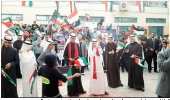
الطلاب يشاركون في احتفال مدارس النجاة بالأعياد الوطنية

وفي هذا السياق أكد مدير قسم الإعلام والعلاقات العامة بمدارس النجاة إبراهيم الخراز أن الحفل اشتمل على فقرات ترفيهية وثقافية شارك فيها الطلبة، حيث تضمن الحفل عرضاً لصور صاحب السمو الأمير الشيخ صباح الأحمد، وسمو ولي العهد الشيخ نواف الأحمد، علاوة على صور أمراء الكويت في العصور السابقة، حيث ارتدى الطلبة ملابس مرسوماً عليها أعلام الكويت رافعين في الوقت ذاته أعلام البلاد في منظر رائع. وأضاف الخراز أن الحفل تضمن كذلك إلقاء الطلبة للأنشيد والأهازيج الوطنية،