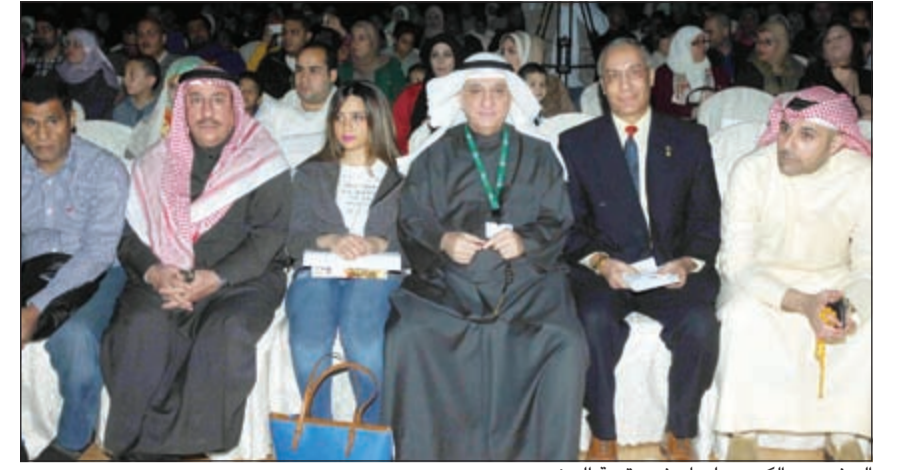
السفير عبدالكريم سليمان في مقدمة الحضور