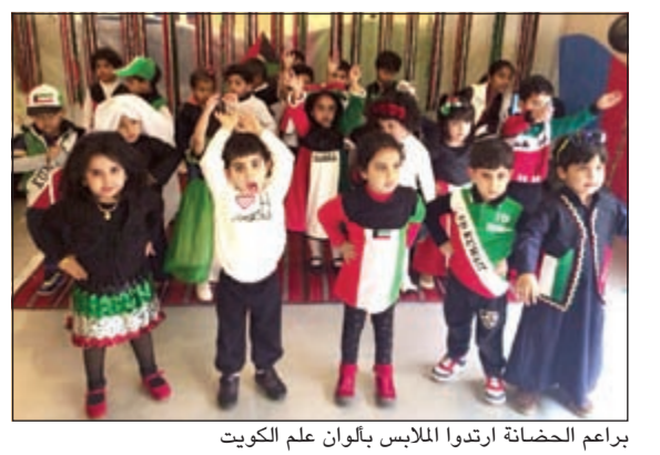
براعم الحضانة ارتدوا الملابس بالوان علم الكويت

ما استقبلوا به من حفاوة الاستقبال من قبل رجال الاطباء الاطفال، وتقدمت ادارة حضانة كيدز بالشكر والتقدير ومعداتهم ومركباتهم المميزة. وقد ودع براعم الحضانة بمثل