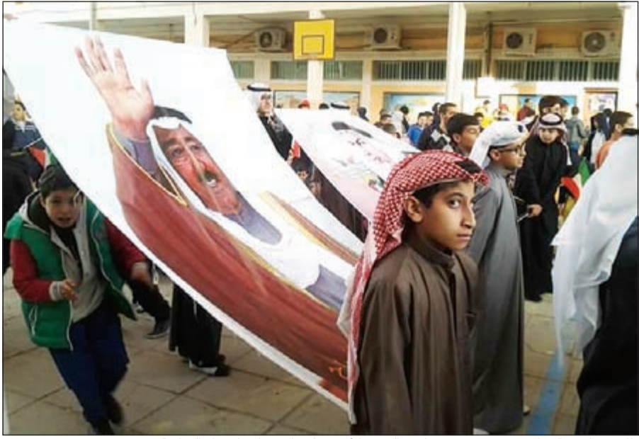
طلاب مدارس النجاة يرفعون صورة صاحب السمو الأمير خلال الاحتفال بالاعیاد الوطنية