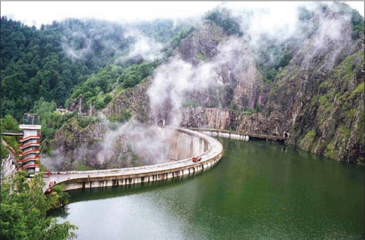
أحد المنتجعات الصحية في رومانيا