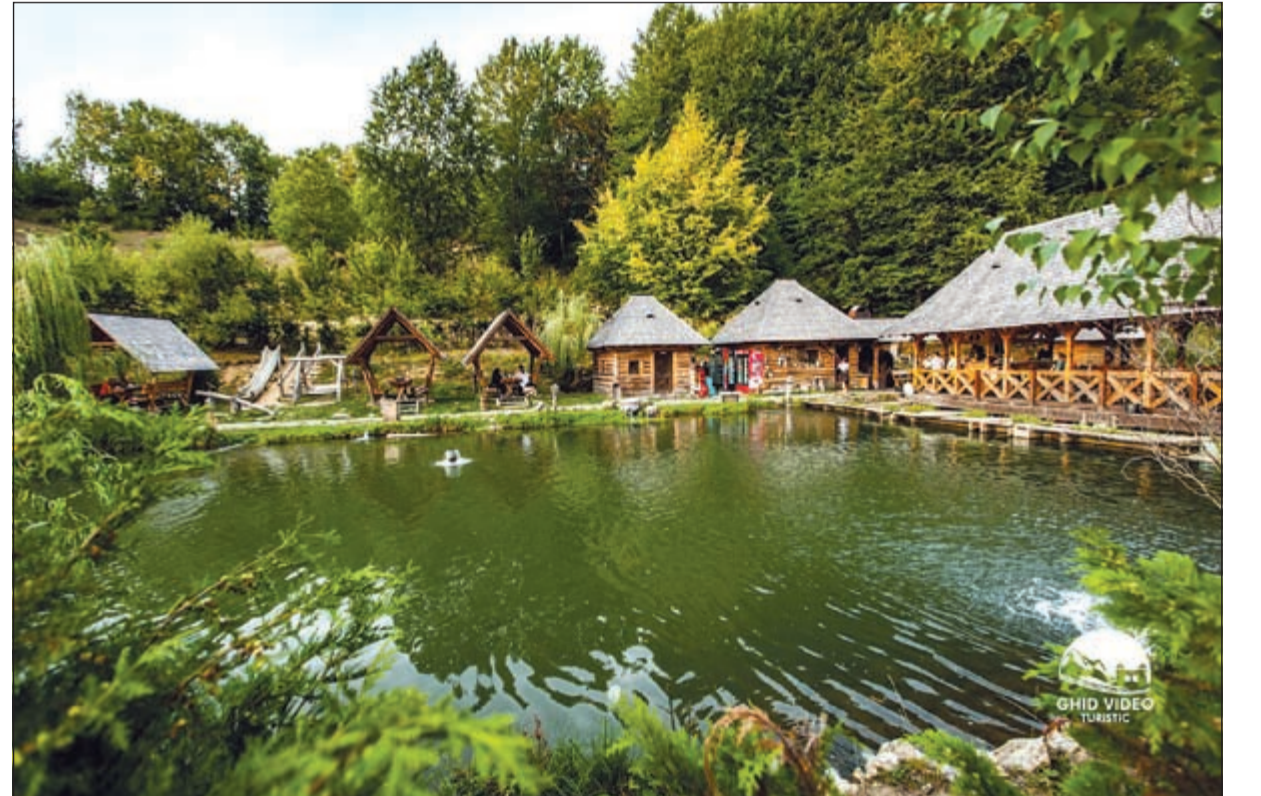
الطبيعة الخلابة من أهم مقومات الجذب السياحي