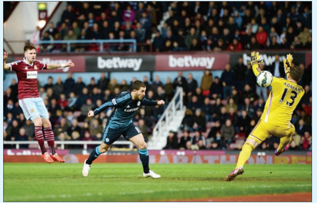
البلجيكي هازارد أثلج صدور البلوز

وتغلب ستوك سيتي على إيفرتون بهدفين نظيفين سجلهما النيجيري فيكتور موزيس (32) والسنگالي مام بيرام ضيوف (84). وتغلب توتنهام على سوانسي سيتي 3-2. سجل للفائز البلجيكي ناصر الشاذلي (7) وراين ماسون (51) اندروس تاوزند (60)، وللخاسر الكوري الجنوبي سونغ يونغ كي (19) والاسلندي سيغور سيغوردسون (89).