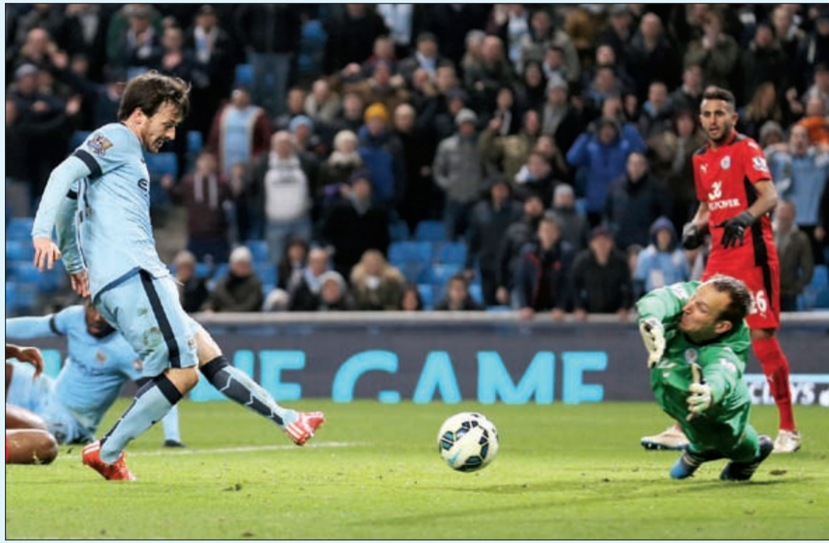
سيلفا يفتتح باب التسجيل للسيتي