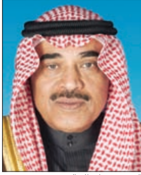
الشيخ صباح الخالد

تلقى النائب الأول لرئيس مجلس الوزراء وزير الخارجية الشيخ صباح الخالد اتصالا هاتفيا من وزير خارجية الجمهورية التركية الصديقة مولود تشاوش أوغلو، تناول خلاله العلاقات الثنائية بين البلدين وسبل تعزيزها في جميع المجالات بالإضافة إلى الاهتمام المشترك.