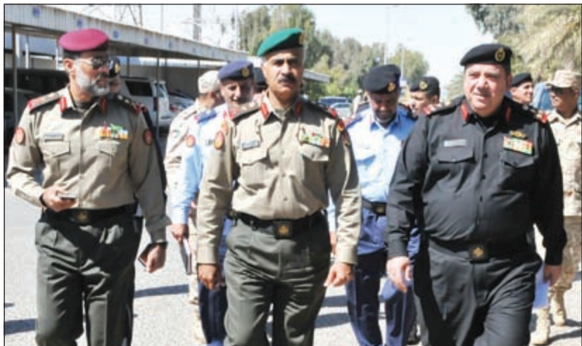
الفريق الركن محمد الخضر خلال الجولة

ونقل الفريق الخضر لمنتسبي القاعدة تحيات نائب رئيس مجلس الوزراء وزير الدفاع الشيخ خالد الجراح وإشادته بقيادة القوة البحرية وجهودها متمنيا للقوة التطوير والإرتقاء إلى مستويات متميزة حتى يكون الجيش الكويتي على أتم الاستعداد منفا لمهامه التي أوكلت إليه ليصون أمن واستقرار الوطن تحت ظل القيادة الحكيمة. من جهة أخرى، أعلن المركز الإعلامي المشترك لتدريب حسم العقبان صباح أمس عن انعقاد اجتماع لمناقشة التحضيرات النهائية لتدريب (حسم العقبان 2015) الذي سوف ينفذه قيادات مختلفة من قطاعات وزارات الدولة، إضافة إلى دول مجلس التعاون لدول الخليج العربية، وعدد من الدول الشقيقة والصديقة اعتبارا من الأسبوع المقبل.