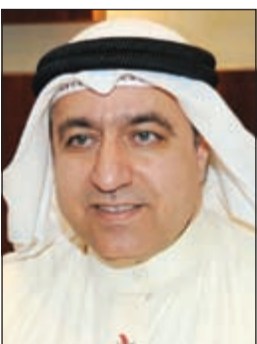
د. محمد بوشهري

وأعتبر بوشهري ان المؤتمر يوفر فرصة ممتازة لتقييم التجارب والخبرات التي جمعت من خلال الألاف من المشاريع التنموية. وأشار إلى ان الوفد الكويتي اجري في اليوم الاول للمؤتمر لقاءات مهمة بحضور سفير الكويت لدى هنغاريا د. حمد بورحمة مع مسؤولين كبار من هيئة المياه الهنغاريا والمسؤولين المعنيين بملف المياه في وزارة الخارجية الهنغاريا اذ تبادل الطرفان وجهات النظر والخبرات حول أحدث التحديات الأكثر إلحاحا. وأعرب رئيس الوفد