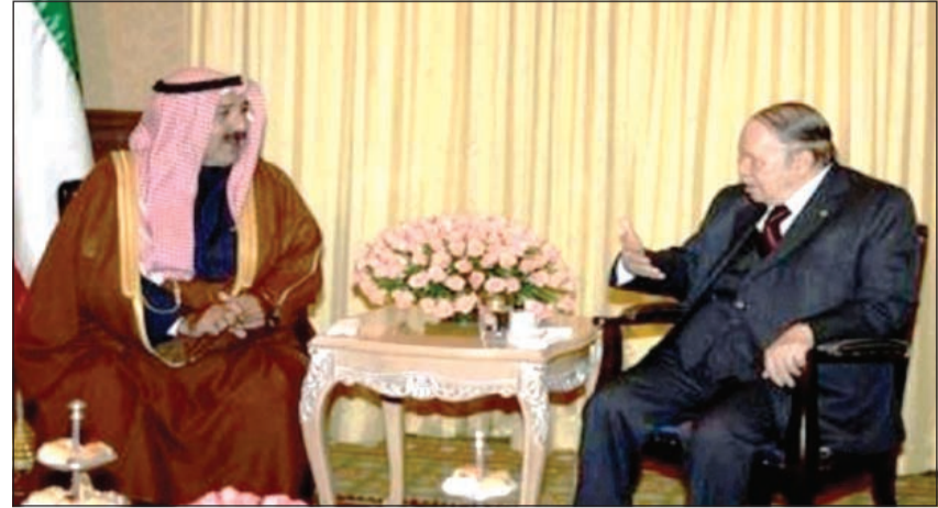
الرئيس الجزائري عبدالعزيز بوتفليقة مستقبلا وزير شؤون الديوان الأميري الشيخ ناصر صباح الأحمد

في الظروف الحالية التي تواجهها الأمة». وأضاف أن «اللقاء بين الرئيس عبد العزيز بوتفليقة وصاحب السمو الأمير حول مواضيع الساعة موجود ويخص مصلحة شعبي البلدين ومصحة الأمة».