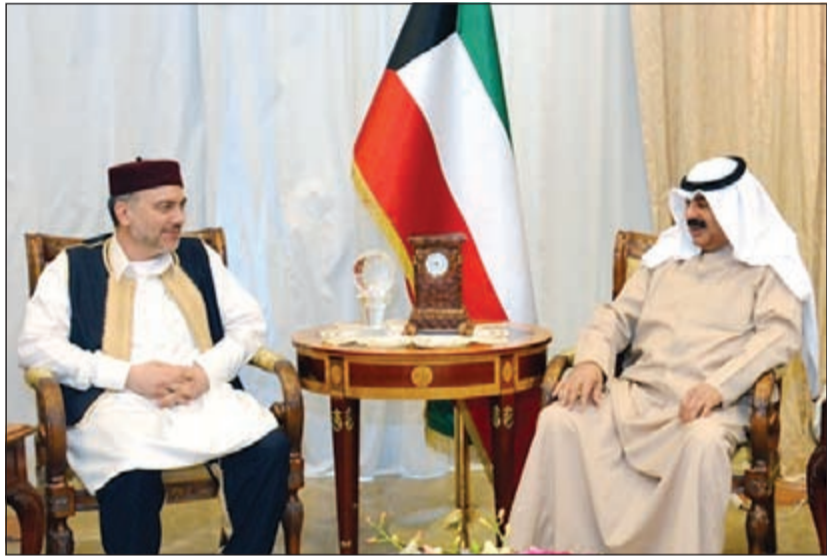
وكيل الخارجية مستقبلا سفير ليبيا محمد عميش