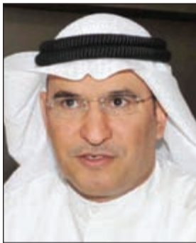
السفير منصور العنبي

نيويورك - كونا: رحب مندوبنا الدائم لدى الأمم المتحدة السفير منصور العنبي في مقر الأمم المتحدة بمجموعة من الطلبة المتفوقين على هامش مشاركتهم في مؤتمر النموذج المصغر لمنظمة الأمم المتحدة.