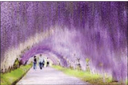
النفق مطلي بقوس قزح

بكين - أ.ش.أ: افتتح في الصين أول نفق من نوعه في البلاد، حيث إن ألوانه الداخلية مطلية بطريقة متدرجة لتمتثل ألوان قوس قزح، ليعطي السائقين الفرصة لإراحة أعينهم عند المرور خلاله، ويمتد النفق الواقع في منطقة «زهومو» في مقاطعة «هانان» بوسط الصين، لمسافة 400 متر، وتكلف بناؤه ما يقرب من 100 مليون يوان (16 مليون دولار). وبحسب المسؤولين عن المشروع، فإن بناء النفق ينقسم إلى ثلاثة أجزاء، الجزء الأوسط منه مبني بأسمنت عادي، أما الجزآن الأخران أي المدخل والمخرج فهما عبارة عن كتل مطلية بألوان قوس قزح، حيث يلاحظ من يمر بالنفق أن اللون يتغير تدريجياً بادئاً بالبنفسجي ومنتهاً بالأزرق.