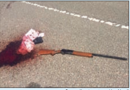
السلاح المستخدم في الجريمة