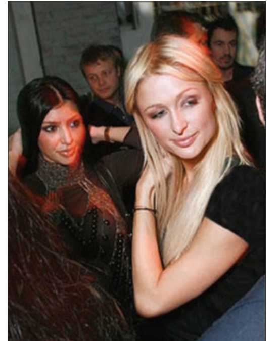
كارديشيان وقت أن كانت مساعدة لهيلتون قبل الشهرة

وكالات: نشرت النجمة كيم كارديشيان عبر حسابها الخاص على موقع التواصل الاجتماعي، صورة جمعتها بالنجمة باريس هيلتون، عندما كانت كيم مساعدة لباريس. والصورة تعود إلى العام 2006، وفي هذا الوقت لم تكن كيم كارديشيان شخصية مشهورة بل كانت تظهر فقط بجانب باريس في المناسبات الاجتماعية، حيث كانت تعمل كمساعدة لها، وعلقت كيم على الصورة «بتهنئة باريس بعيد ميلادها».