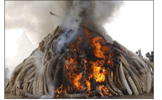
إحراق العاج في كينيا

نيروبي - أ.ف.ب: أضرم الرئيس الكيني، اوهورو كينياتا، النار في 15 طناً من العاج، وهي أكبر كمية من العاج تتلف في أفريقيا، متعهداً بإتلاف المخزون المتبقي في البلاد المقدر بمائة طن بحلول نهاية العام الحالي، وبيع الكيلوغرام الواحد من العاج بنحو 2100 دولار، ويتركز الطلب عليه خصوصاً في الصين، وعلى ذلك فإن القيمة المتلفة تبلغ 30 مليون دولار. وتعد كينيا من أكثر البلدان التي تتركز فيها ظاهرة الصيد غير الشرعي للفيلة التي باتت على حافة الانقراض، وأيضا تتركز فيها تجارة العاج. وقال الرئيس الكيني قبل إشعال النار في العاج المقدس في الحديقة الوطنية في نيروبي «علينا أن نجعل العاج غير قابل للاستخدام في كل العالم». وأضاف «ما يبذل من جهود لحماية التنوع البيئي مازال غير كاف، نظراً للمخاطر المحدقة بالبيئة». لقد بات من الملح مضاعفة الجهود للتصدي للجرائم المرتكبة بحق الطبيعة، وتشير الأرقام الرسمية في كينيا إلى قتل 300 فيل و59 حيوان وحيد قرن في العام 2013، لكن الخبراء يقدرون أن يكون العدد أكبر بكثير. ويؤدي الصيد غير الشرعي لتلبية الطلب على شراء العاج إلى قتل 20 - 30 ألف فيل سنوياً في أفريقيا، ما يضع هذا النوع الحيواني على حافة الاندثار.