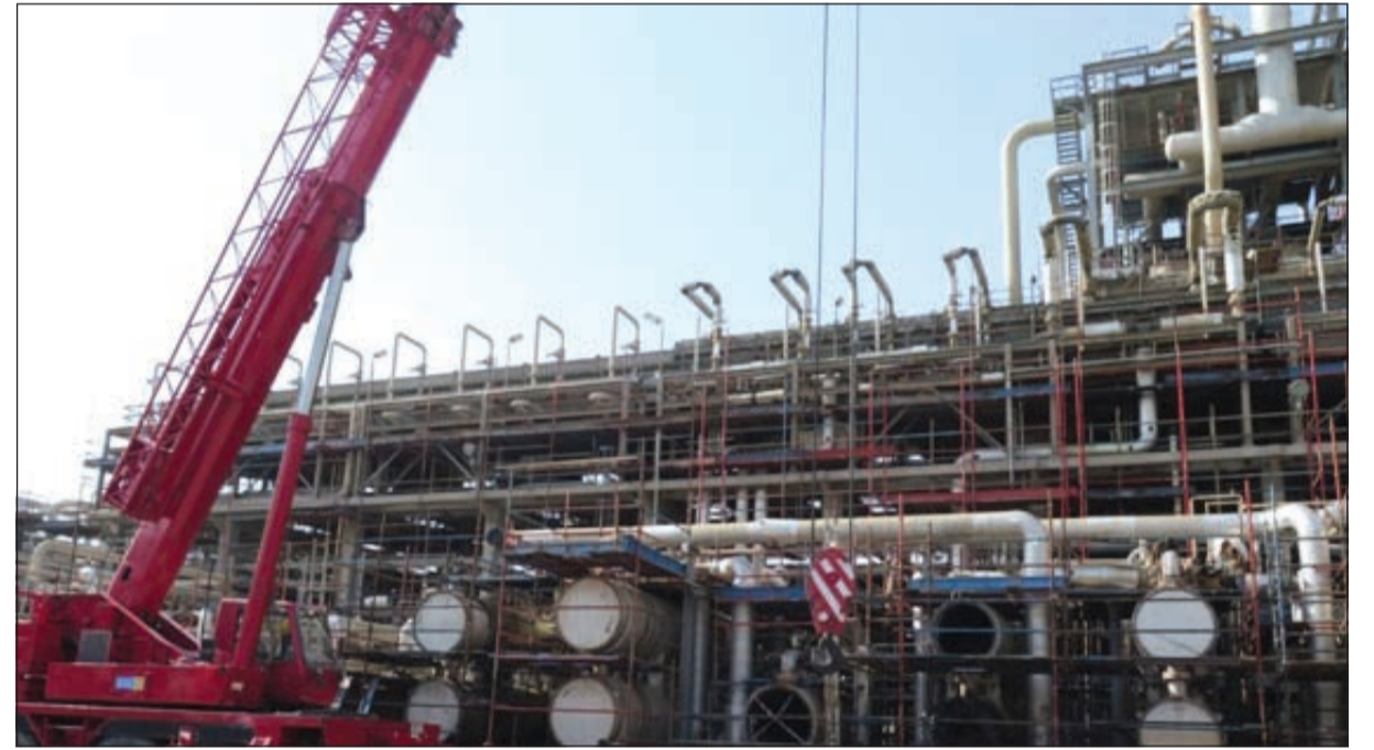
وحدة تطوير النفط الخام الخامسة