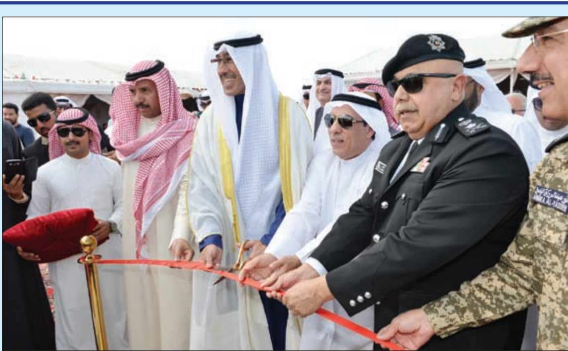
جانب من قص شريط مشروع تطوير منفذ النويصيب البري