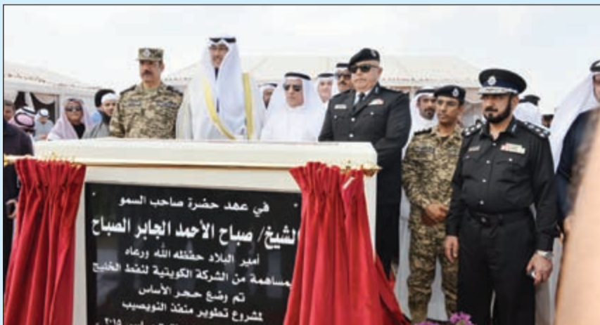
لقطة جماعية خلال وضع حجر الأساس للمشروع

أقامت الشركة الكويتية لنفط الخليج حفل وضع حجر الأساس لمشروع تطوير منفذ النويصيب البري وهو المشروع الذي ترعى الشركة تنفيذه، وذلك بحضور