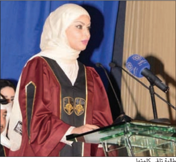
طالبة تلقي كلمتها

على طريق البناء والتنمية نلتقي دوما بقوافل من أبناء الكويت وقد تنوعت مهاراتهم وتعددت قدراتهم، واليوم تكرم «التطبيقي» نخبة من خيرة شبابها المتميزين في كافة التخصصات في الحفل السنوي لتكريم الخريجين برعاية كريمة