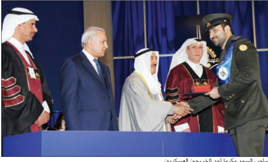
صاحب السمو مكرما أحد الخريجين العسكريين