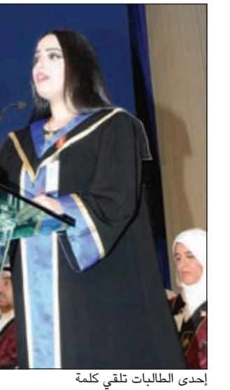
إحدى الطالبات تلقي كلمة