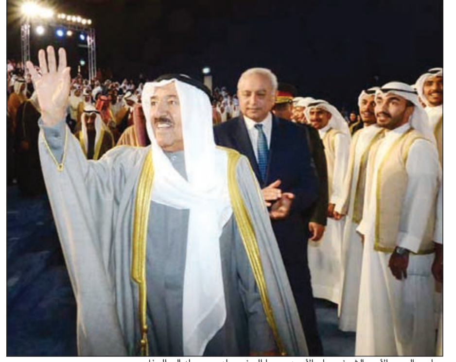
صاحب السمو الأمير الشيخ صباح الأحمد محييا الحضور لدى وصوله الى الحفل