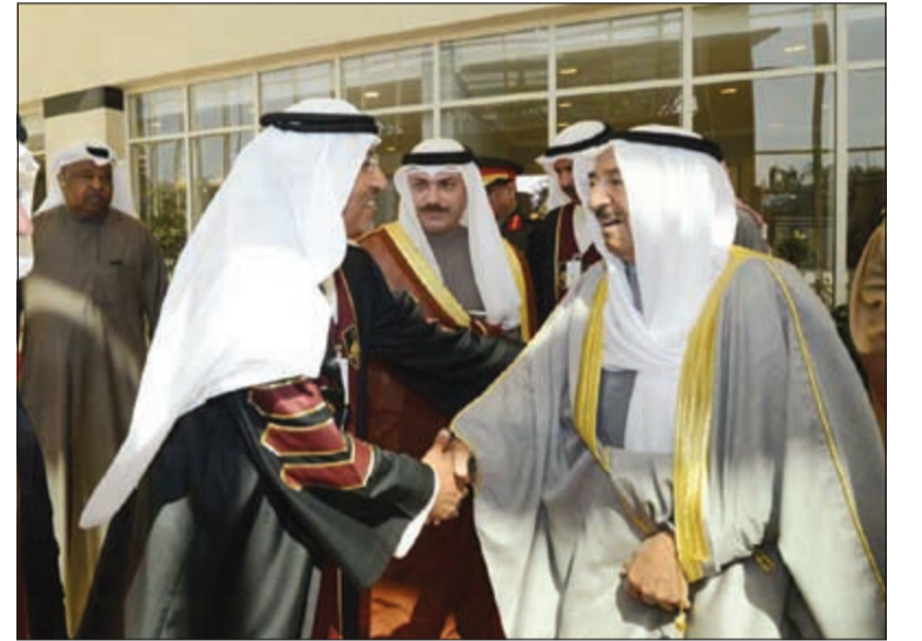
صاحب السمو الأمير مضافاً أحد مستقبليه

للعام التاسع ونحتفل معه بعياد الكويت الوطنية. نعلم أنه يوم سيبطل في الذاكرة لأنه متوج بتكريم الوالد بأحرف من نور فسي تاريخ العطاء والعمل الإنساني بآباد بيضاء تمتد في كل مكان من بقاع العالم ونحن أبناء الكويت نبغ سعادتنا مداهما بهذا التقدير الدولي المشرف لأمرنا المفدى ولكويت العطاء مركزاً للعمل الإنساني.