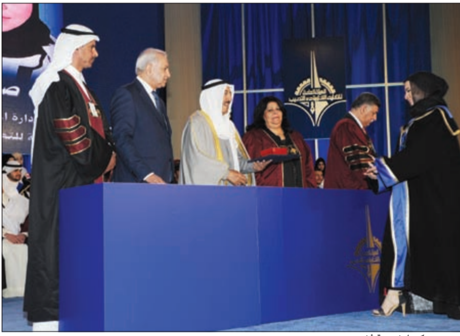
وسموه مكرما خريجة أخرى

شرف على صدور أبناء الهيئة جميعا، والفخر لنا أبناء الكويت بمقام صاحب السمو الأمير «قائد العمل الإنساني» الذي يعرفه البعيد قبل القريب، فسموه ينقن لغة الإنسانية بغض النظر عن الجنس أو اللون، والعرق أو الدين،