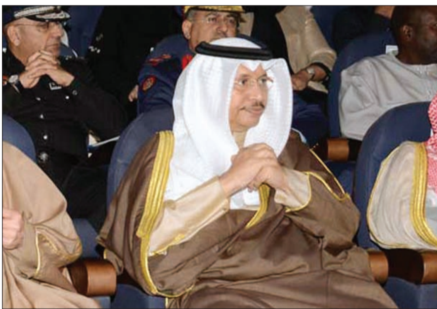
سمو رئيس الوزراء الشيخ جابر المبارك

.. والشيخ صباح الخالد مضافاً دخليفة ببهاني