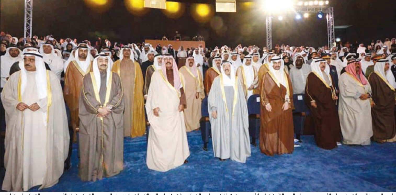
صاحب السمو الأمير الشيخ صباح الأحمد وسمو ولي العهد الشيخ نواف الأحمد ومرزوق الغانم وجاسم الخرافي والشيخ فيصل السعود والشيخ مشعل الأحمد وسمو الشيخ جابر المبارك