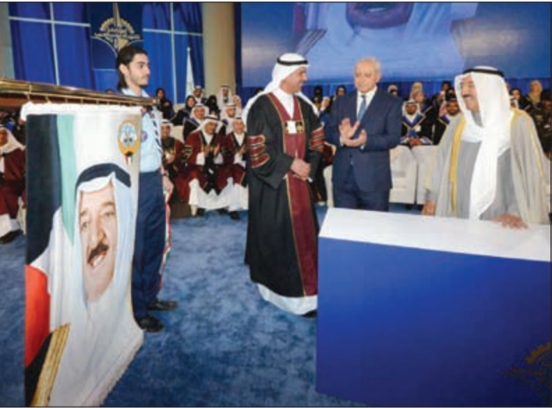
العيسى والأثري يقدمان هدية تذكارية لصاحب السمو الأمير