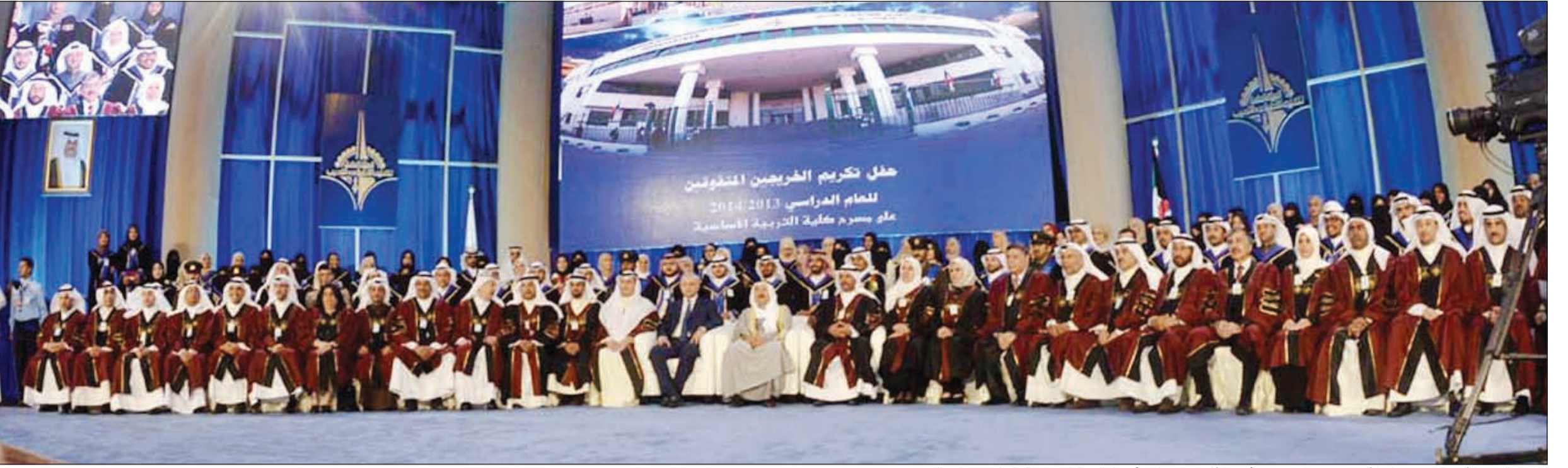
صاحب السمو الأمير الشيخ صباح الأحمد و د. بدر العيسى و د. أحمد الأثري يتوسطون أعضاء الهيئة التدريسية بالتطبيقي خلال الحفل