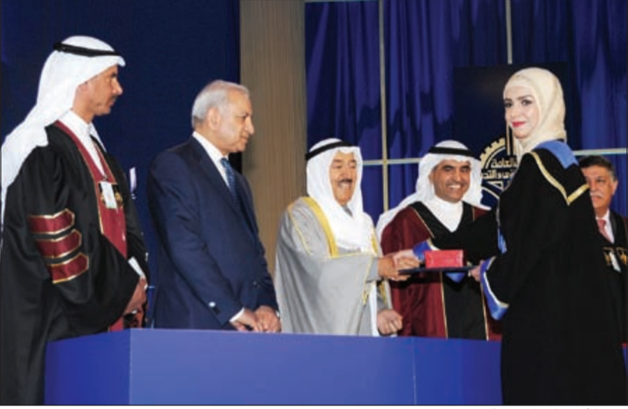
سمو الأمير مكرما خريجة