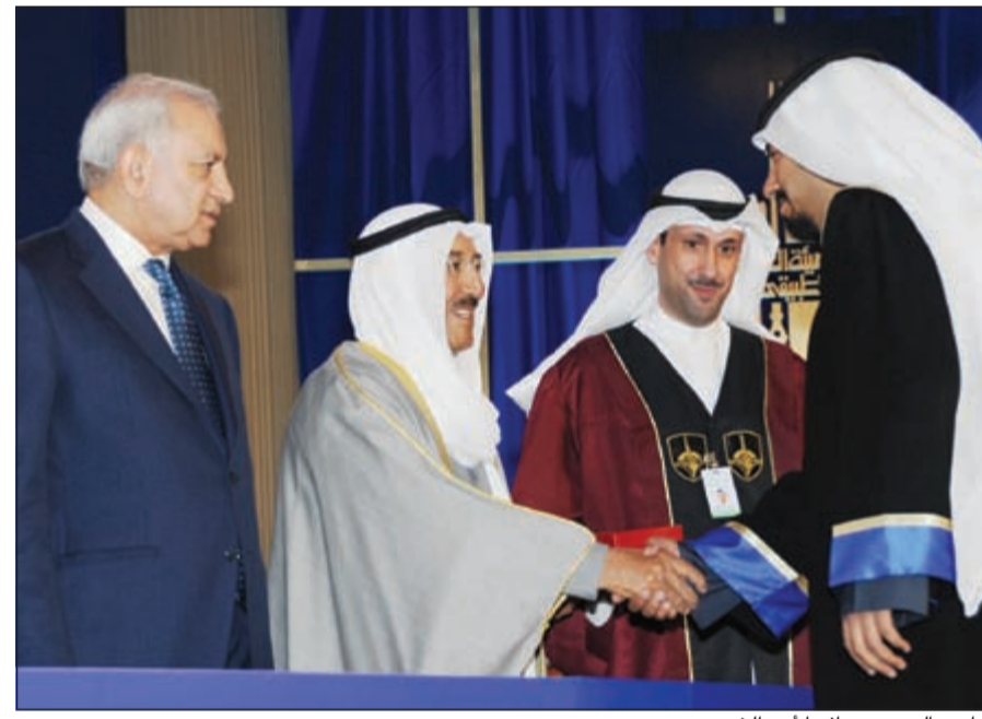
صاحب السمو مصافحا أحد الخريجين

ولايماننا باهمية التعليم التطبيقي من جهة وضرورة التكريم من جهة اخرى فيجب فصلهم عن بعضهم البعض في المرحلة القادمة حتى يتسنى لكلاهما القيام بدوره المنشود والتميز في الاداء من خلال خطط منفصلة لتطوير المناهج واسلوب التعليم والتدريب ليتواءم مع متطلبات سوق العمل مع تفعيل القوانين وسن الجديد منها لمنحهم الاستقلالية في قراراتهم الابدائية والتعليمية والمالية حتى يتمكنوا من تأدية