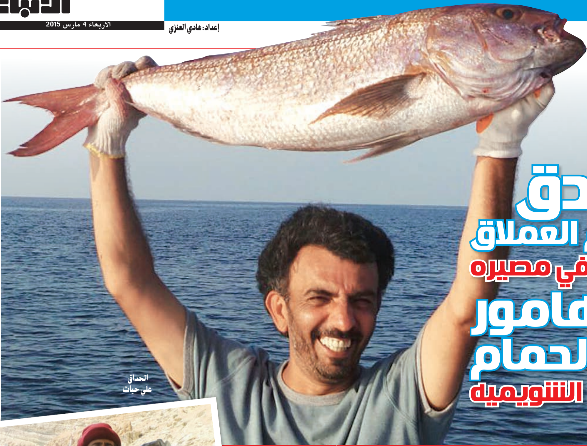
الحداق علي حيات