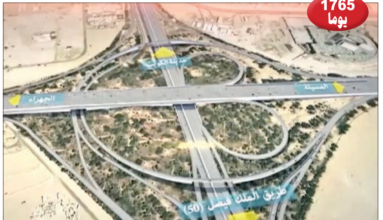
حتى إنجاز تقاطع رقم 7 في مشروع طريق 6,5 بين الدائري السادس والسابع