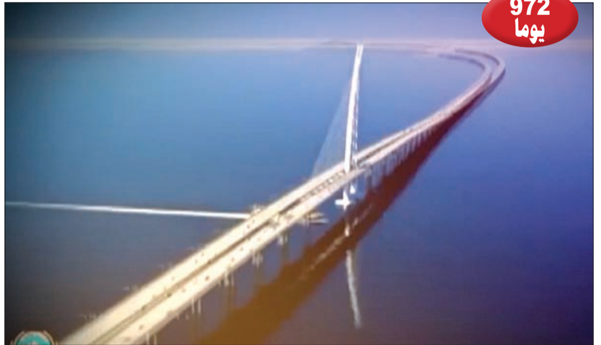
حتى إنجاز جسر الشيخ جابر