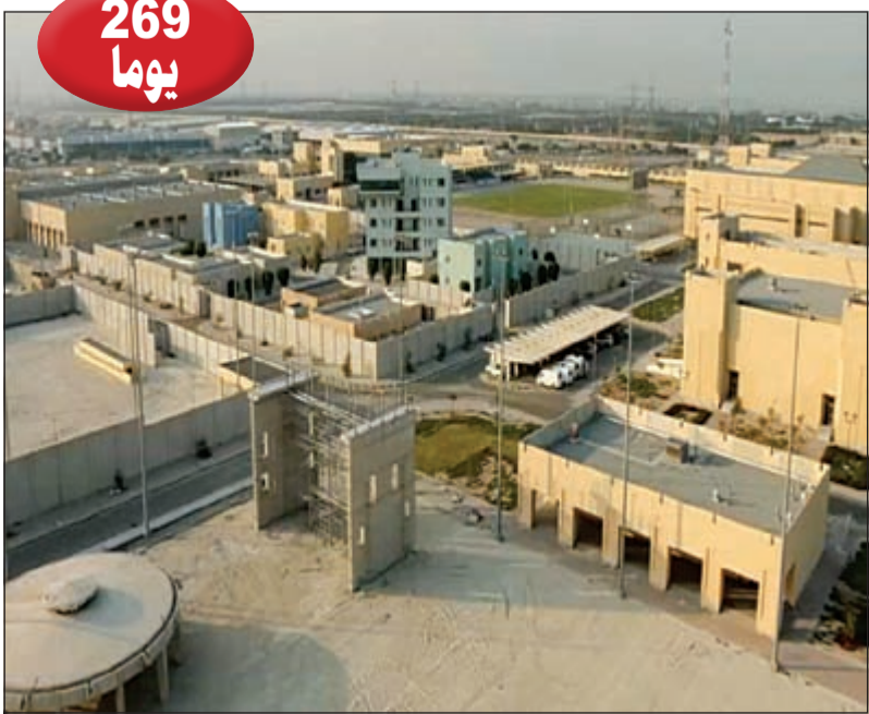
حتى إنجاز مبنى القوات الخاصة الجديد