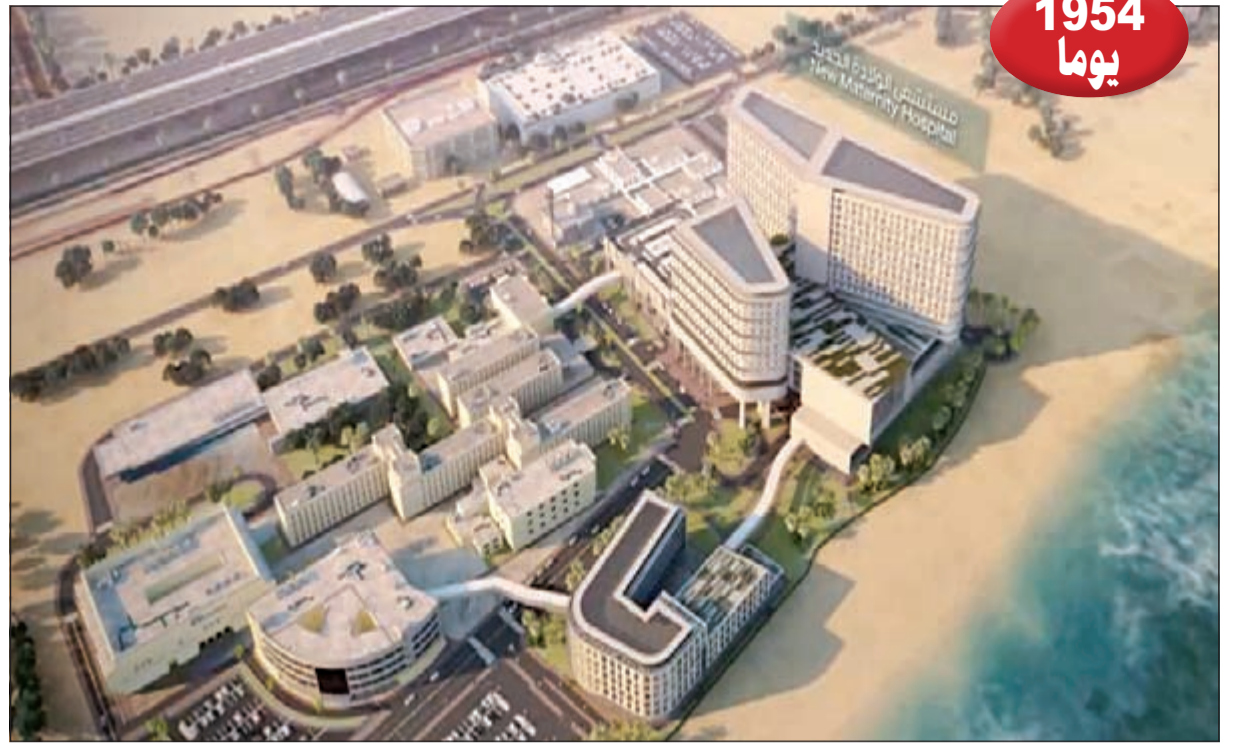
حتى إنجاز مستشفى الولادة الجديد