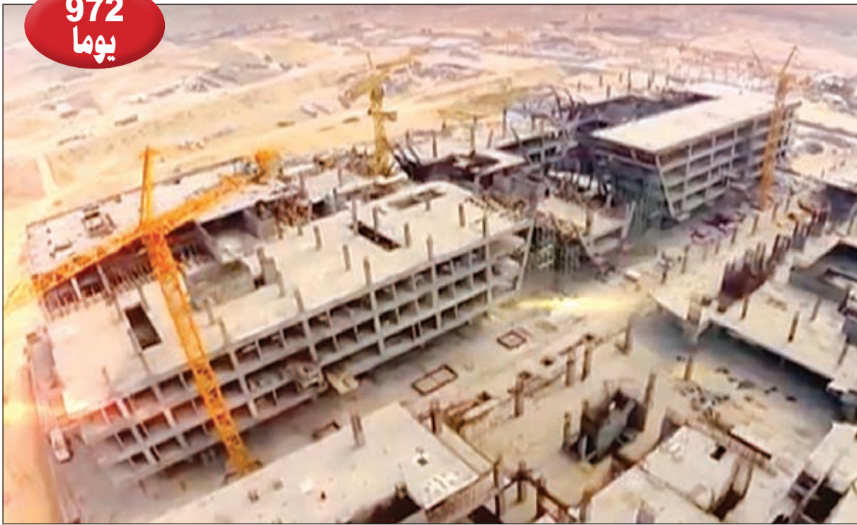
حتى إنجاز مدينة صباح السالم