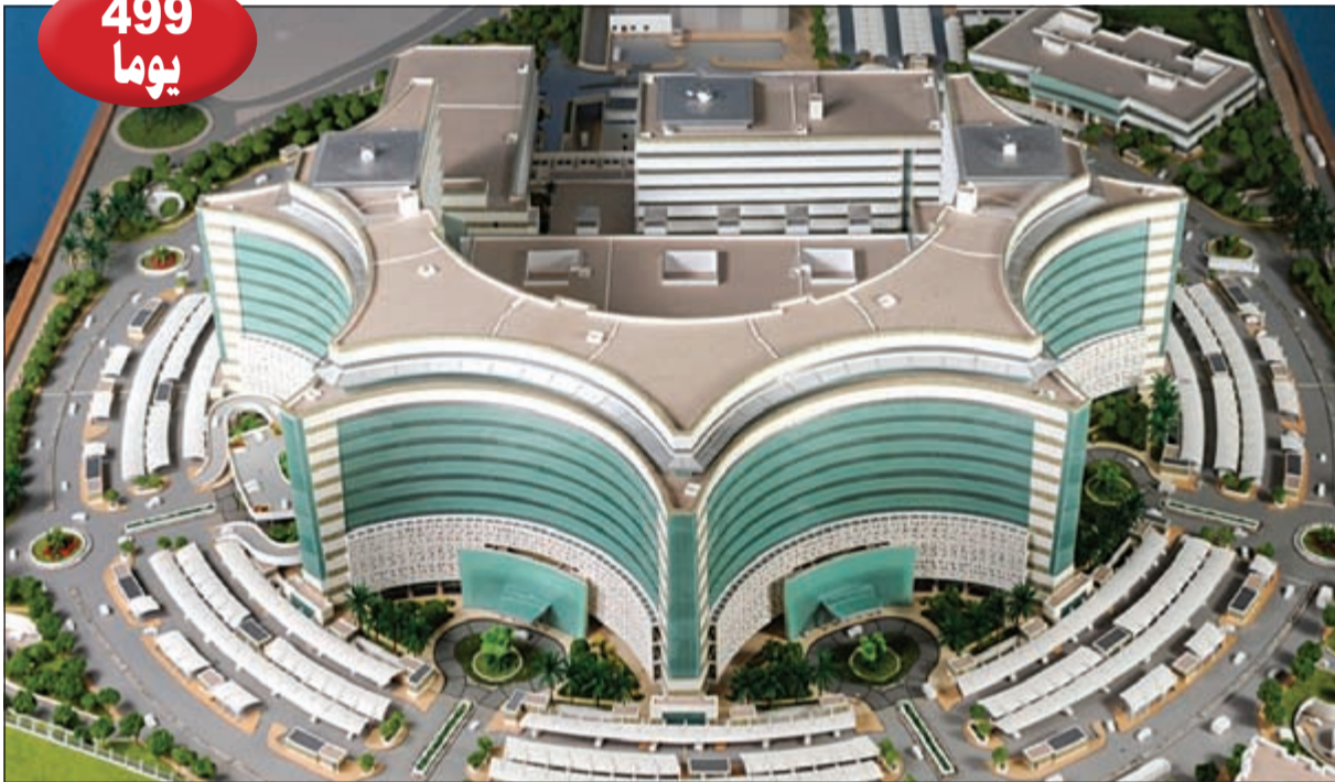
حتى إنجاز مستشفى جابر