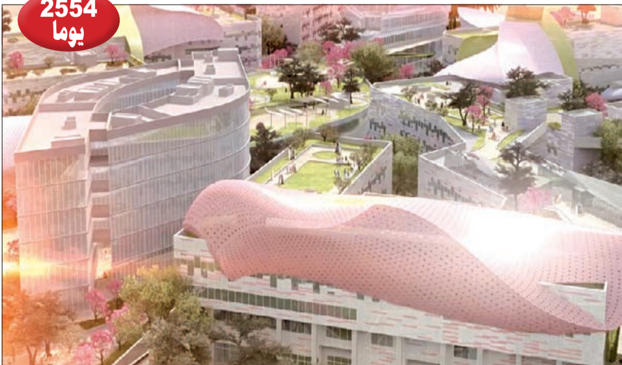
حتى إنجاز مشروع مدارس ذوي الاحتياجات الخاصة