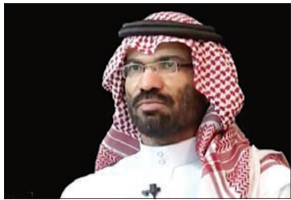
القنصل السعودي المحرر عبد الله الخالدي

الرياض - واس - رويترز: أعلنت المملكة العربية السعودية إن قنصلها في اليمن، عبدالله الخالدي عاد إلى الرياض امس، بعد أن أطلق سراحه، حيث أمضى ثلاث سنوات محتجزاً كرهينة. ونقلت وكالة الأنباء السعودية الرسمية «واس» عن مصدر مسؤول بوزارة الداخلية السعودية قوله امس «أنه نتيجة للجهود المكثفة التي بذلتها رئاسة الاستخبارات العامة فقد وصل إلى أرض الوطن بسلامة الله القنصل السعودي في عدن عبدالله محمد خليفة الخالدي الذي سبق أن اختطف من أمام منزله بحي المنصورة في عدن وهو في طريقه إلى مكتبه صباح يوم 28 مارس 2012 ليتم تسليمه بعد ذلك في صفقة مشبوهة إلى عناصر الفئة الضالة التي احتجزته قسراً في مخالفة صارخة للمبادئ والأخلاق الإسلامية والعربية، فضلاً عن أحكام العهود والمواثيق الإنسانية