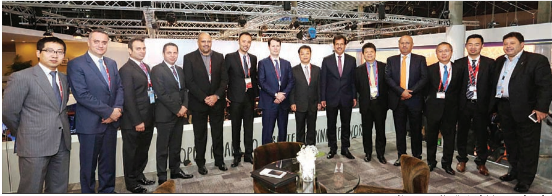
لقطة جماعية عقب توقيع اتفاقية التعاون المشتركة بين «زين» وشركة «هواوي»

عالية الجودة في أي وقت وفي أي مكان. وفي ضوء علاقتنا طويلة الأمد مع شركة «زين» نلتزم في «هواوي» بتقديم المنتجات المتطورة والحلول المناسبة لمساعدة «زين» على الانتقال بسلاسة إلى مستقبل زاهر في عالم الاتصالات المتحركة. ويعتقد الخبراء أن تطبيق تقنيات الجيل 4,5 من شأنه توفير سرعة اتصال أعلى للمستخدمين، بالإضافة إلى توفير زمن وصول أقل ووظائف أفضل من تلك التي تقدمها تقنيات الجيل الرابع المتاحة حالياً. كما ستنفتح المجال أمام مصادر دخل جديدة بالنسبة للمشغلين من خلال جذب مزيد من فرص الأعمال الجديدة وتعزيز الربحية في مجال الخدمات المتنقلة ذات النطاق العريض.