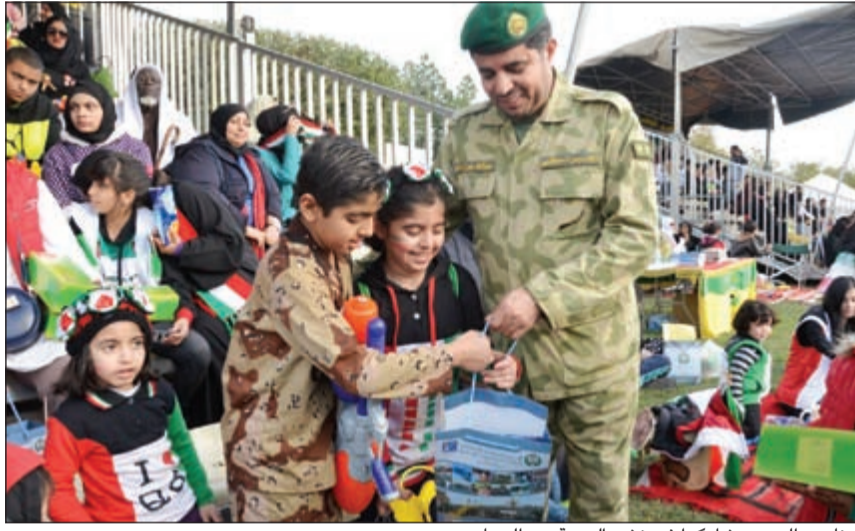
عناصر الحرس شاركوا في نشر البهجة بين الجماهير

حيث جابت شارع الخليج ونالت استحسان الجمهور، كما نصبت المدرجات التي وفرت سبل الراحة للمواطنين والمقيمين خلال المسير، وتم توزيع الهدايا والوجبات الخفيفة على الجمهور. وأضاف أن فرع العلاقات العامة والتوعية في مديرية التوجيه المعنوي أقام رقنا خاصا بالحرس الوطني في معرض محافظة مبارك الكبير وتواصل مع الجمهور مقدما الهدايا والكتيبات التوعوية التي تركز الانتماء للوطن، لافتا إلى أن نادي ضباط الحرس الوطني أقام احتفالية تضمنت أنشطة خاصة بالأعياد الوطنية في مسابقات وفقرات فنية استهدفت تثقيف الأبناء والأسر بالمسيرة المباركة والكوتيت، متمنيا أن يعيد المولى عز وجل هذه المناسبات الطيبة وكويتنا الحبيبة تزهو في ثياب العزة والرأفة.