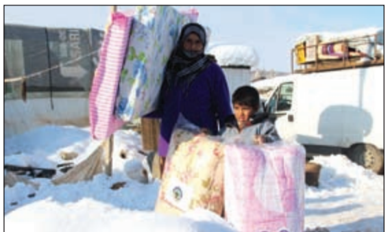
توزيع المساعدات على المتضررين

تقي مصارع السوء... ودعا السيف أهل الكويت الكرام إلى فزعة إنسانية لإنقاذ آلاف الأطفال والنساء والعجائز من الموت المحقق نتيجة العواصف الثلجية التي اقتلعت خيامهم وأغرقتهم، وأصابت الأطفال بالجمد والأمراض الشتوية مثل الإنفلونزا والإسهال والالتهابات وغيرها من امراض الشتاء، كما يصعب عليهم الذهاب إلى المستشفيات والحصول على الدواء، خاصة الأمراض المزمنة كالسكري وغيره مناشدا أهل الخير بالكويت سرعة التبرع للحملة عن طريق الاتصال على 9666689 أو عن طريق التبرع عبر الموقع الإلكتروني للجمعية Alnouri.org.