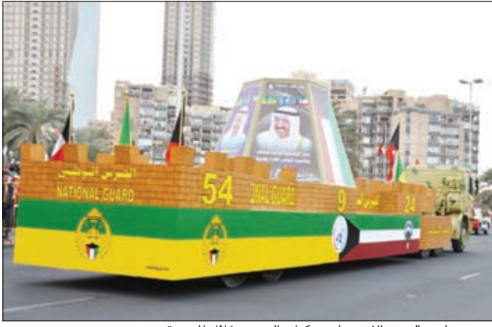
صور صاحب السمو الامير على مركبات الحرس خلال المسيرة