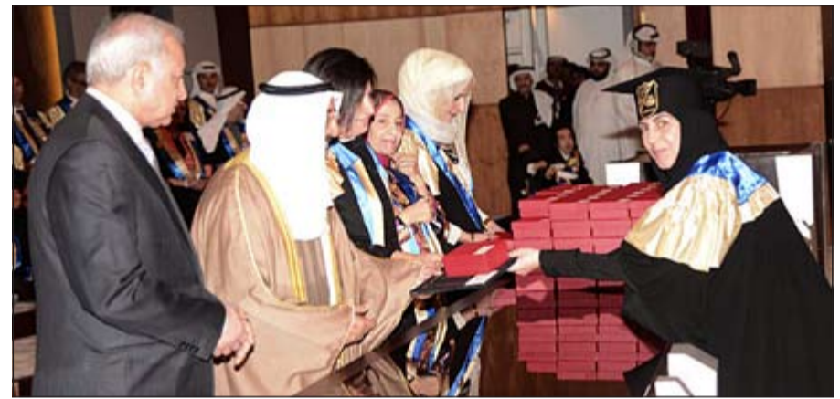
صاحب السمو الأمير مكرماً إحدى الخريجات

صاحب السمو تشمل برعايته وحضوره حفل توزيع شهادات الإجازة الجامعية على الخريجين