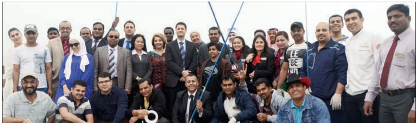
لقطة تذكارية للمشاركين بالمسابقة

على عدد الأسماك المصادة بغض النظر عن حجمها أو وزنها أو نوعها، وتم إعلان الفائز عند نهاية المسابقة، حيث تم مكافأته خلال الحفل الشهري للموظفين.