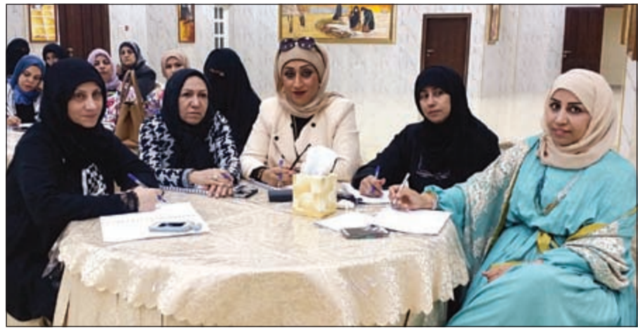
مديرات مدارس إدارة التعليم الخاص