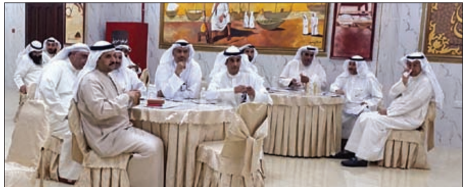
متابعة من مديري مدارس إدارة التعليم الخاص