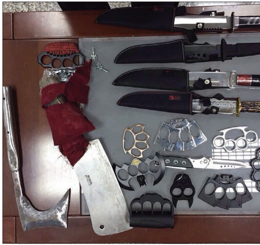
خناجر عسكرية وساطور وبلطة ورنقات ضبطها رجال جمارك المطار