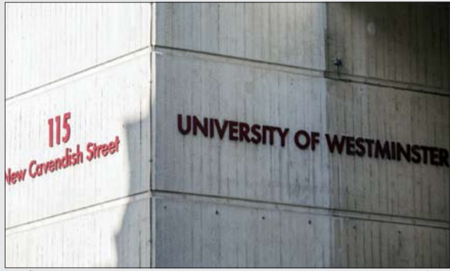
جامعة وستمنستر حيث درس «جزار داعش»

وكانت «كايج» التي تتولى دعم المعتقلين بتهم تتصل بالإرهاب ذكرت أن إموازي اتصل بها قائلًا أنه تعرض لضايقات من أجهزة الأمن البريطانية بعد أن حاول العودة إلى الكويت عام 2010 ليتزوج ويلتحق بوظيفة، وقال في رسالة كتبها إليها بالبريد الإلكتروني «أشعر كاني سجين، لا يقص بل في لندن»، وفق تعبيره. وذكر إموازي في الرسالة أنه كان يشعر بأنه سجين تتحكم فيه أجهزة الأمن «التي تمنعني من بدء حياة