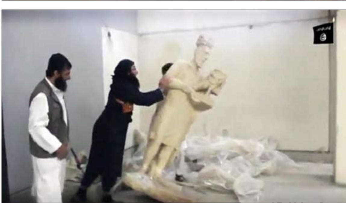
صور مأخوذة من مقطع فيديو منشور على حساب مرتبط بداعش يقوم فيه عناصر التنظيم بتحطيم الآثار في متحف الموصل

عواصم - وكالات: أُنعت منظمة الأمم المتحدة للتربية والعلم والثقافة (يونسكو) مجلس الأمن بعقد اجتماع طارئ ليبحث حماية التراث الثقافي للعراق في أعقاب تدمير تنظيم داعش محتويات متحف الموصل.