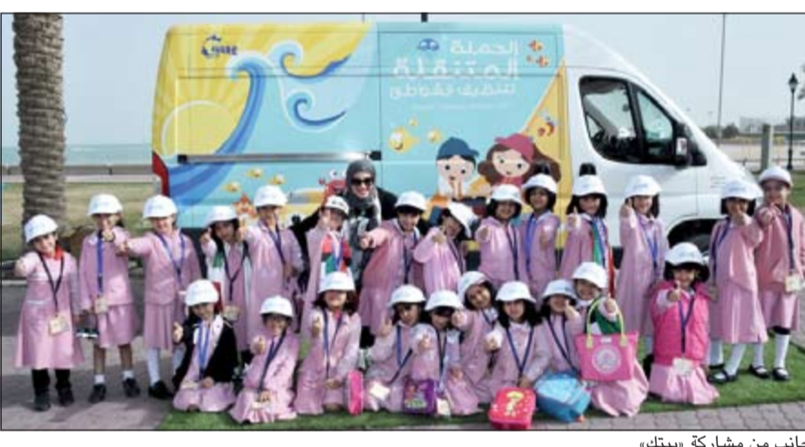
جانب من مشاركة «بيتك»

تمثل أهمية كبيرة في حياة المجتمعات وتؤثر على حياة الأفراد، كما يعد الحفاظ على البيئة وحمايتها عنواناً للتقدم الحضاري ومشاركة الانسانية في تطلعاتها نحو بيئة خالية من الملوثات وشواطئ نظيفة وحياة أفضل. وتشغل قضايا البيئة وتبعاتها حيزاً كبيراً في اهتمامات «بيتك»، ومكوناً مهماً في مسؤوليته الاجتماعية التي تعبر عن مدى ارتباطه بالمجتمع وقضاياها المهمة التي تؤثر بشكل مباشر على حياة الأفراد ومن شأنها الدفع بقدراته نحو النمو والتطور على جميع المستويات. شارك بيت التمويل الكويتي (بيتك) في الحملة المتنقلة لتنظيف الشواطئ، بالتعاون مع المرة التطوعية البيئية، تزامناً مع الاحتفالات باليوم الوطني وذكرى التحرير، وذلك إيماناً من «بيتك» بأهمية البيئة النظيفة وضرورة الاهتمام بها والمشاركة بدور في الحملات والمساهمات التطوعية لتعزيز ثقافة البيئة وحمايتها من التلوث. وتمثل مشاركة «بيتك» صورة من مسؤولياته الاجتماعية واستعداده للتعاون مع الهيئات والمؤسسات والجهات المعنية بقضايا المجتمع، وفي مقدمتها البيئة التي أصبحت