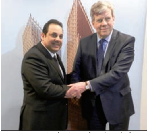
يعقوب الصانع مع الوزير الهولندي أيفو أوبتيلتين

لاهاي - كونا: ناقش وزير العدل ووزير الأوقاف يعقوب الصانع أمس مع وزير العدالة والأمن الهولندي أيفو أوبتيلتين سبل تعزيز التعاون بين البلدين لاسيما في مجالات العدل والأمن ومكافحة الإرهاب. ووصف الوزير الصانع في تصريح له «كونا» وتلفزيون الكويت زيارته الأولى إلى لاهاي بأنها «مهمة للغاية» وقد بدأت بقاءه مع وزير العدل والأمن، مشيراً إلى أنه تمت مناقشة عدد من القضايا المهمة مثل مكافحة الإرهاب ومكافحة تمويله والتعاون في مجال العدالة بين البلدين.