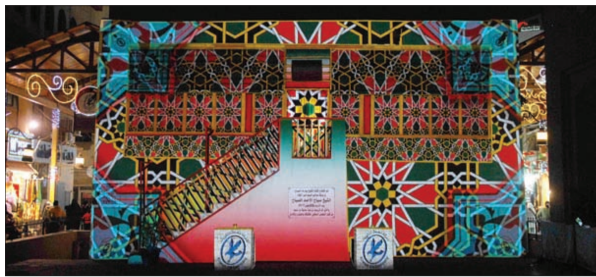
جانب من العرض الضوئي

كما تقدم الهاشم بأسمى التهاني والتبريكات إلى مقام صاحب السمو الأمير الشيخ صباح الأحمد، وإلى سمو ولي العهد الشيخ نواف الأحمد وإلى جموع الشعب الكويتي والمقيمين على أرضها الطيبة.