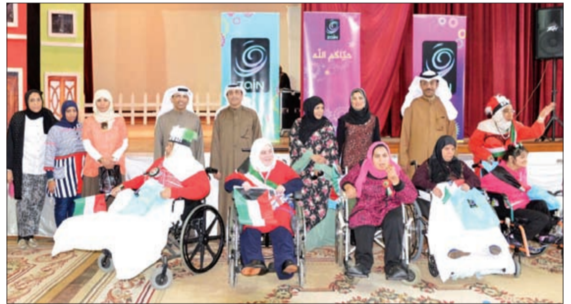
موظفو الشركة مع ذوي الاحتياجات الخاصة