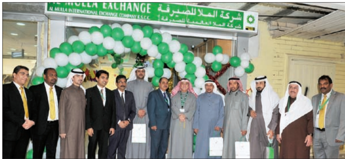
افتتاح فرع «الملا للصرافة» في منطقة الجبراء

بيئة مريحة وملائمة لإتمام التحويلات الخاصة بالعملاء بسرعة وأمان. يذكر أن الشركة تقدم خدمات التأمين ونقاط الولاء مجاناً على كل معاملة، فضلاً عن تأكيد عمليات التحويل من خلال الرسائل النصية القصيرة (SMS)، مبيناً أنها أيضاً توفر سرعة وأمان تحويل الأموال من المنازل أو المكاتب، من خلال خدمة الانترنت عن طريق الشبكة الخاصة (www.amxremmit.com).