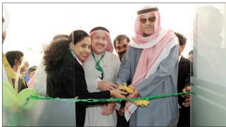
جانب من افتتاح فرع الرقعي

وتابع: «بكل تأكيد يمكننا القول إن اختيارنا لافتتاح ثلاثة أفرع في كل من الجبراء والرقعي وضاحية جابر العلي مبني على أهمية هذه المناطق باعتبارها من أهم المراكز الحيوية في الكويت، وبالتجهيزات الكاملة التي تضمها الأفرع، نحن على استعداد لتقديم جميع خدماتنا ومنتجاتنا للعملاء، وسنستمر ارتباطاً متيناً بأفضل المؤسسات المالية العالمية». ويأتي افتتاح الأفرع الجديدة في وقت واحد يعكس مساعي الشركة في تنفيذ سلسلة من المبادرات والبرامج الاستراتيجية