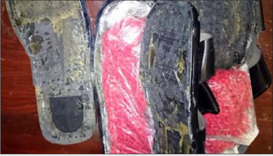
طريقة تهريب أمضحت مكررة