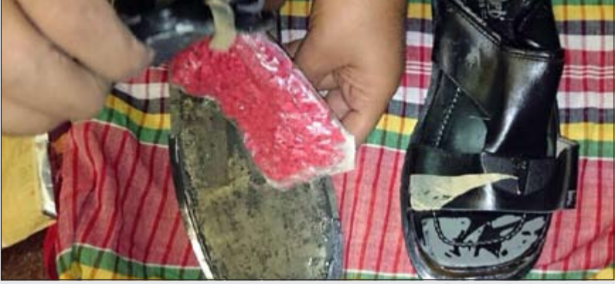
المصنوبات أحيلت الي «المكافحة»

محمد الدشيش - هاني الظفيري عبد العزيز فرحان