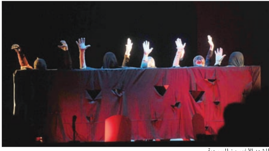
المشهد الاخير من المسرحية

بعد نهاية العرض المسرحي اقيمت الندوة التطبيقية لمسرحية «الحارس»، وذلك في قاعة عبدالرحمن الصالح، وقد