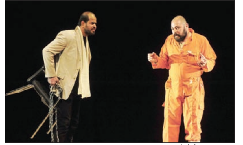
مشهد من مسرحية «الحارس»

قدمتها «فنون بغداد» بعد مرور 24 عاما على التحرير في «المسرح الأكاديمي»