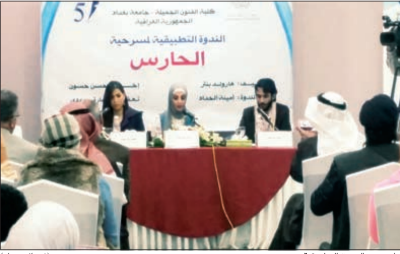
جانب من الندوة التطبيقية (فريال حماد)