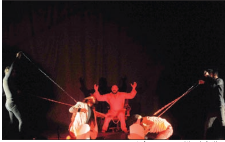
استغلال الحارس للاخوين في تحقيق اهدافه